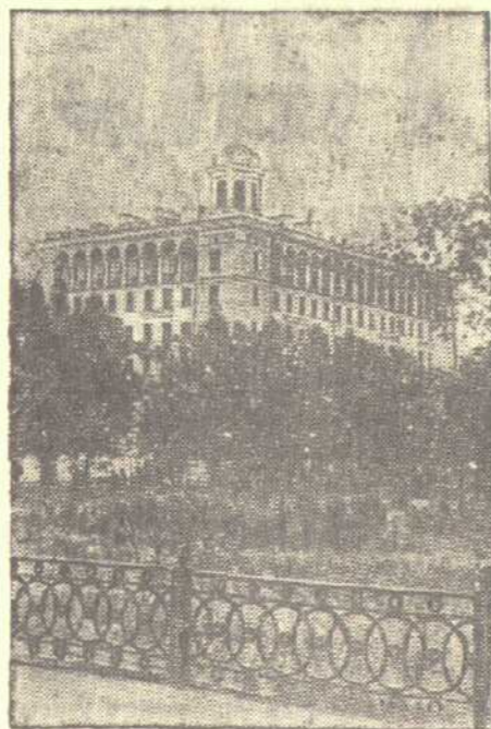
Новый многоквартирный жилой дом металлургов по проспекту 25 Октября.

В индивидуальном социалистическом соревновании рабочих по профессиям первые места и звание лучших по своим специальностям присвоено 9 стаханов-