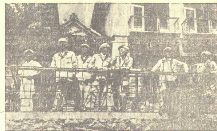
Китайская Народная республика. В городе Датънем открылся первый китайский дом отдыха. Здесь лежат и отдыхают рабочие, передовики трудового соревнования предприятий города.

Такое письмо было опубликовано в нашей газете № 94. Заведующий горкомхозом тов. Струнина сообщил нам, что мост отремонтирован.