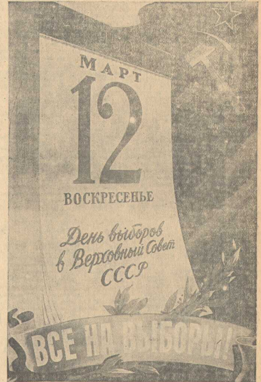
Плакат работы художника К. Ивановой (издательство «Искусство»).

Советской Армии, о росте культуры и искусства. Агитатор С. Я. Кузьмина ознакомил нас с Положением о выборах в Верховный Совет СССР. Недавно мы прослушали доклад на тему: «26 лет без Ленина под руководством Сталина, по де-