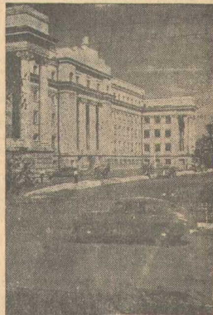
По Советскому Союзу. Дом Советов в Чкалове. Здание построено в прошлом году.

В Великолукской и Воронежской областях начались областные турниры.