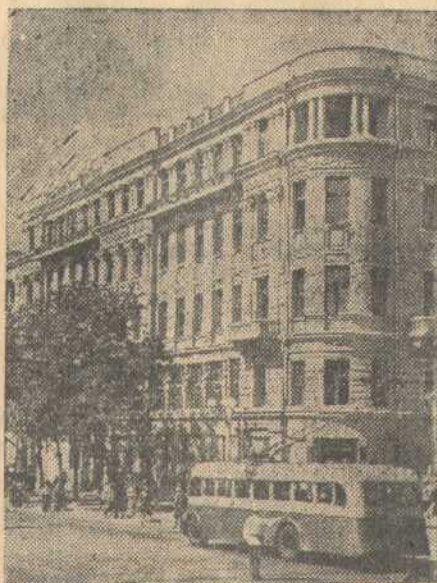
Ростов-на-Дону. На улице Энгельса закончено восстановление здания финансово-экономического института. На двух факультетах занимается более 750 студентов. На снимке: здание Ростовского финансово-экономического института.