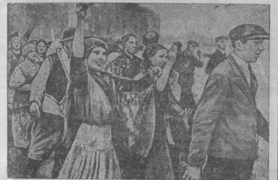
В Первомайскую демонстрацию на площади Побед.

Да здравствует вождь мирового пролетариата, наш дорогой и любимый товарищ Сталин!