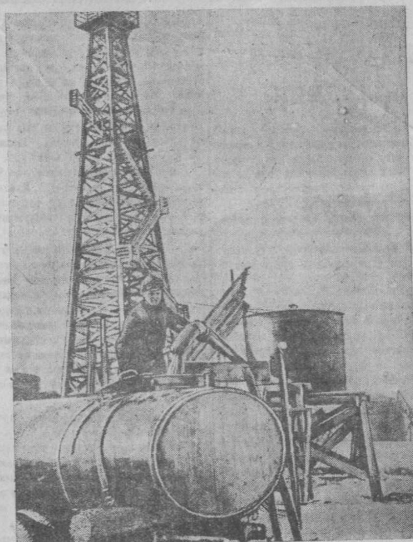
В третьей сталинской пятилетке в районе между Волгой и Уралом будет создана новая нефтяная база «Второе Баку». На снимке: налив добытой нефти в автоцистерну на нефтепромыслах треста «Сызраньнефть».

Субтропические районы Грузии, Крыма, Армении, Таджикистана, Краснодарского края с избытком покроют потребности парфюмерной промышленности. (ТАСС).