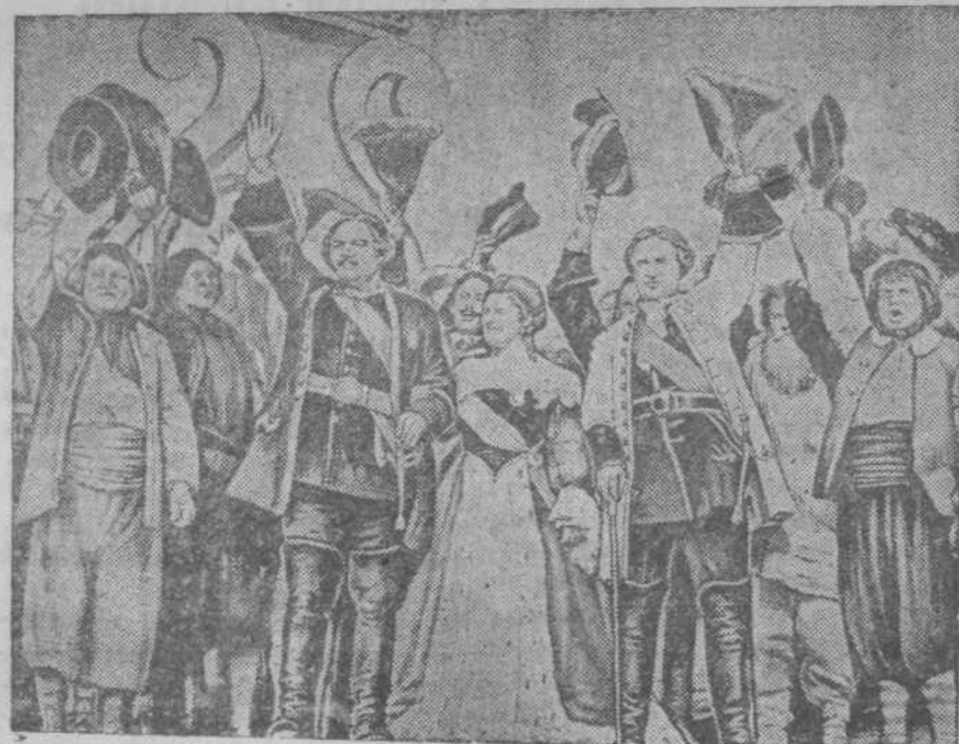
Вторая серия кинофильма «Петр Первый». Производство Ленинградской орденена Леониде Киностудии «Ленфильм». Режиссер— заслуженный артист Республики—орденоносец В. М. Петров. На снимке: кадр из фильма—«Празднование на Троицкой площади по поводу победы русских войск над шведами». В центре—артист орденена Н. К. Симонов в роли Петра Первого и народная артистка СССР—орденена А. К. Тарасова в роли Екатерины. Справа—заслуженный артист—орденена М. И. Жаров в роли Меньшикова.

В ведение городского совета передаются: трамвай, канализация и водопровод, шоссевые дороги, электросеть города и садовопарковое хозяйство. Постройки на Островской площадке, в Старокузнецке и 5 домов в Соцгороде