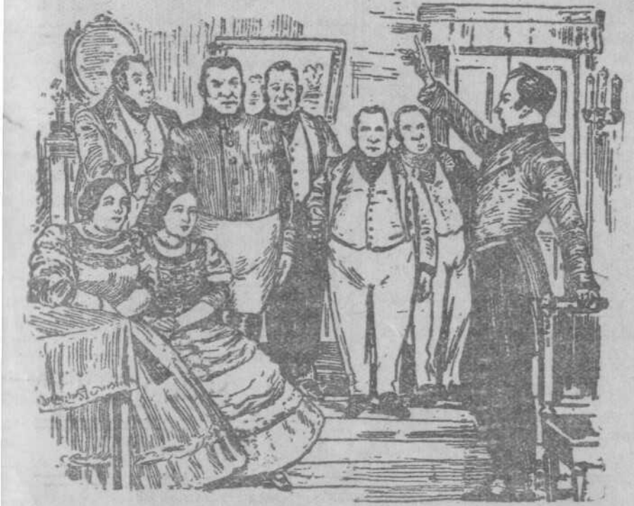
Из комедии Н. В. Гоголя: «Ревизор» — Хлестаков: «Можете представить себе, двадцать пять тысяч одинх курьеров!».