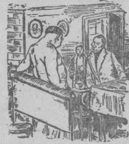
«Нога моя не будет у вас в доме». Из повести Н. В. Гоголя «О том, как поссорился Иван Иванович с Иваном Никифоровичем».

жился, потерял чувство ответственности перед государством и колхозниками за порученную ему большую и почетную работу. Только поэтому ни один из колхозов Сыдорковского сельсовета не готов к посевной кампании.