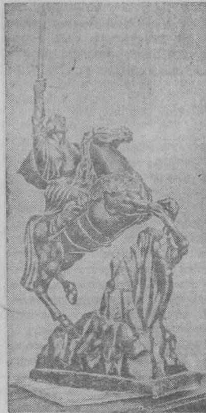
В залах Ереванского исторического музея открывается большая выставка живописи, скульптуры и других экспонатов, посвященная тысячелетию «Давида Сасунского». НА СНИМКЕ: экспонат выставки — скульптура «Давид Сасунский на коне» — работы О. Беджанияна.

ЕРЕВАН, 14 сентября. (ТАСС). Вечера закрылась научная сессия армян-