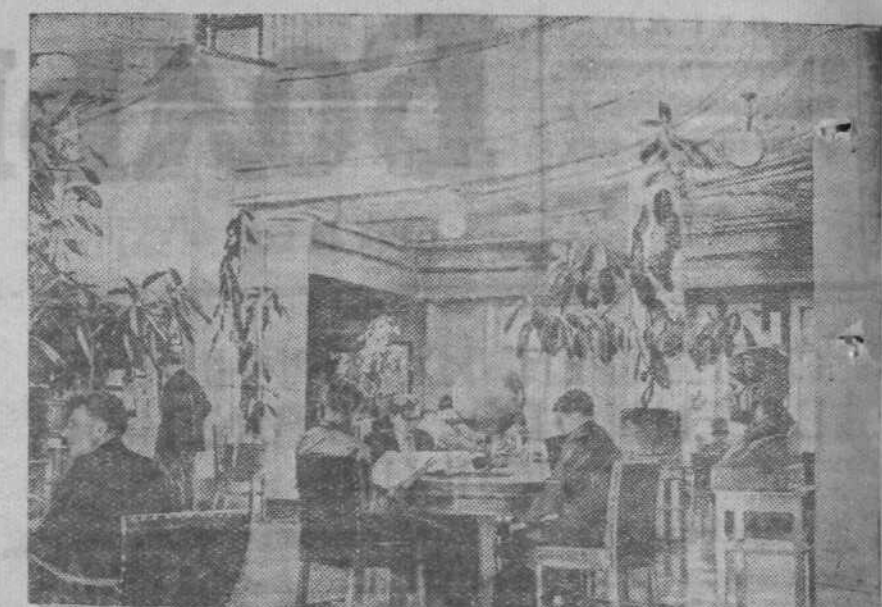
В читальном зале Дворца культуры металлургов (г. Сталинск).