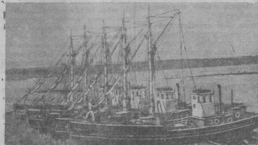
НА СНИМКЕ: новые рыболовецкие суда — кавасаки Астраханской судостроительной фирмы Кирова, предназначенные для моторно-рыболовецких станций. Фотохроника ТАСС.

сяч передовиков железнодорожного транспорта, почти 4 тысячи угольщиков, столько же металлургов. В них побывало более 2 тысяч лучших учителей начальных и средних школ. В профсоюзных домах отдыха с начала года побывало более 1.700 тысяч трудящихся.