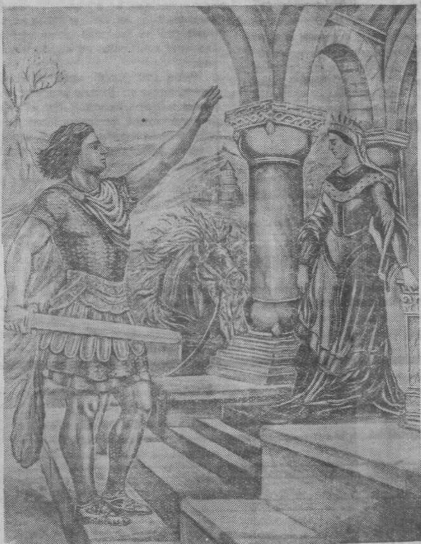
К 1000-летию юбилею армянского народного эпоса „Давид Сасунский“ готовится богато иллюстрированное издание „Давид Сасунский“. НА СНИМКЕ: одна из иллюстраций юбилейного издания „Давид Сасунский“ — „Клятва Давида перед своей невестой Хандут Хатун об уничтожении врагов ее отца“.