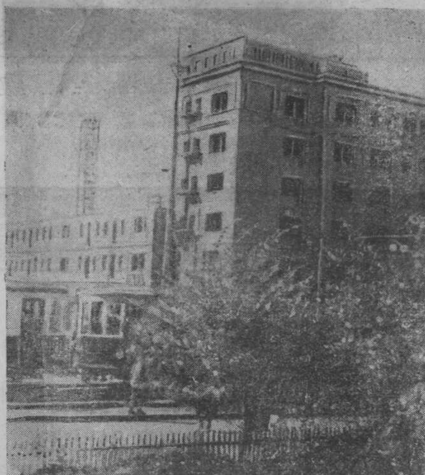
На проспекте Молотова (г. Сталинск) для металлургов завода строится 140-квартирный жилой дом. НА СНИМКЕ: на строительстве нового дома.

НЬЮ-ЙОРК, 3 сентября. (ТАСС). Юнайтед пресс сообщает, что в Венгрии объявлено военное положение. Введена цензура на печать.