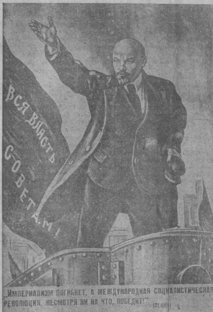
Новый плакат художника И. Тондзе, выпущенный издательством «Искусство» к 15-летию со дня смерти Владимира Ильича Ленина. (Дата съемки 30-XII 1938 г.).

Брать народа, орудовавшие в отдельных звеньях управленческого аппарата завода, много поработали, чтобы ослабить единоначалие, умалить права мастеров, начальников смен, начальников участков. Они культивировали безынициативность средних командиров производства. Надо быстрее ликвидировать последствия вредительства в этой области.