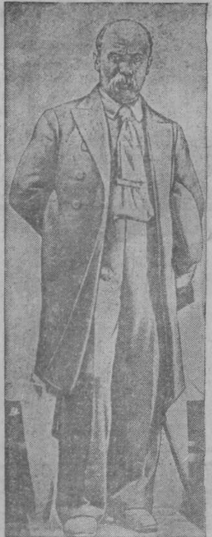
Скульптурная фигура Т. Г. Шевченко, предназначенная для памятника, который будет установлен в Киеве к 125-летию юбилею со дня рождения великого украинского поэта-революционера.

В испанском вопросе позиция Чемберлена также сводится к полной капитуляции перед Италией. Как утверждает дипломатический обозреватель газеты «Сендей экспресс»,