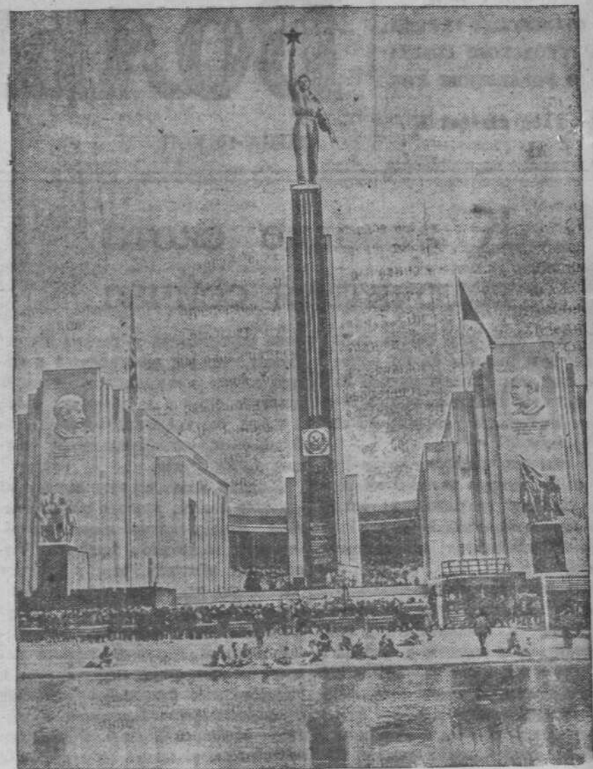
Международная выставка в Нью-Йорке. НА СНИМКЕ: советский павильон на выставке.