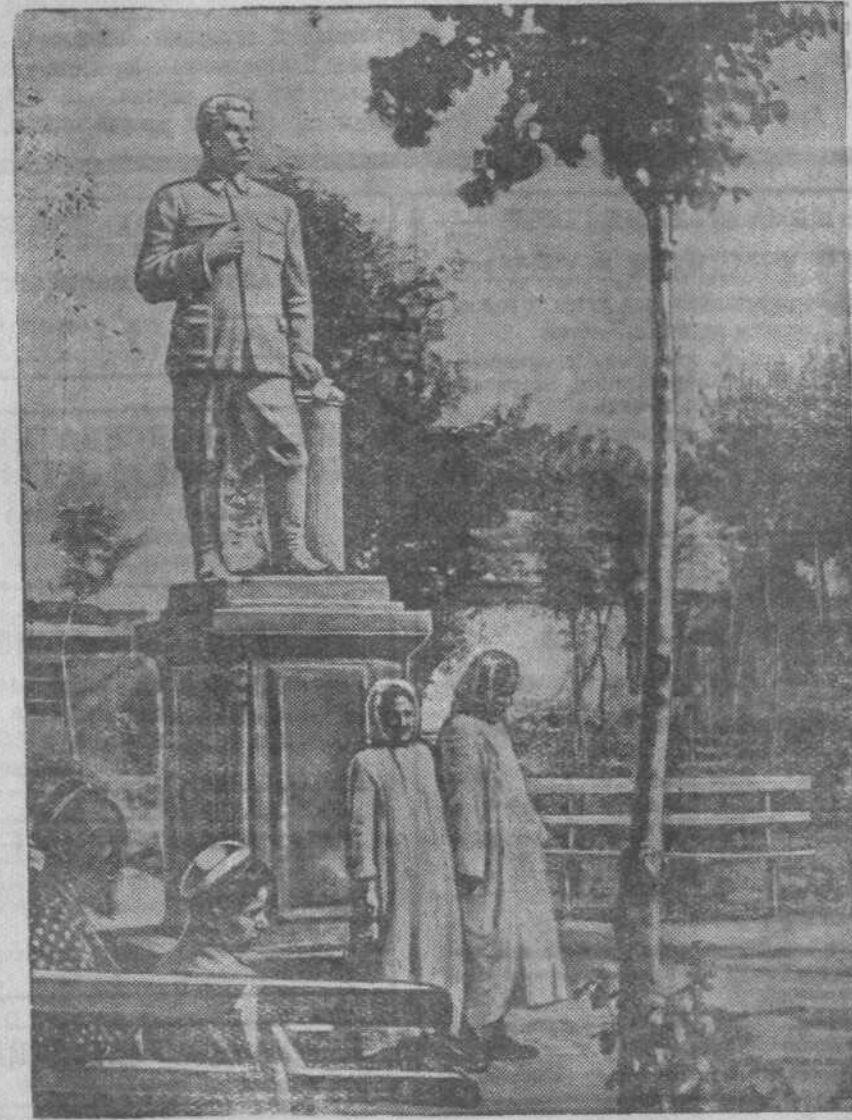
В колхозе имени Сталина (Бухарский район, Узбекская ССР) открыт парк культуры и отдыха. На снимке: в парке колхоза имени Сталина, Сельфоту,