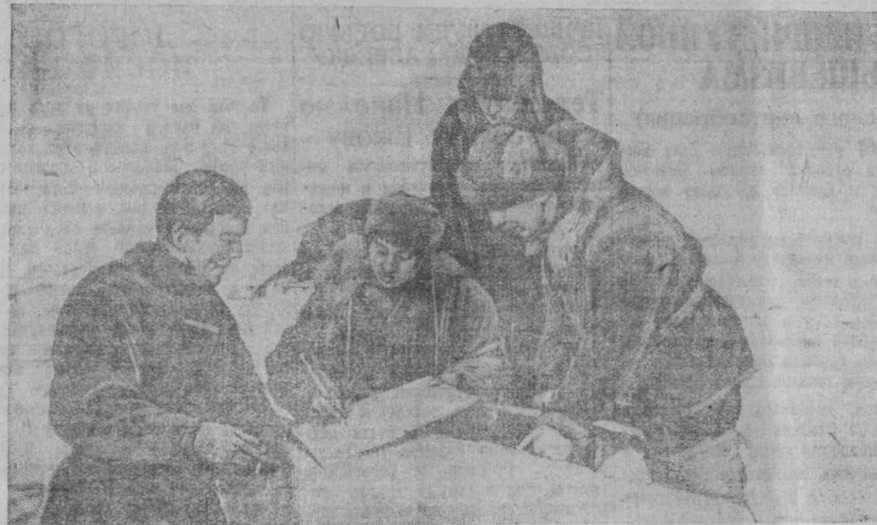
19 февраля в 17 час 30 мин действующая станция «Северный полюс» закончила свою работу. Героическая четверка папанинцев была снята с дрейфующей льдины в Гренландском море славными экипажами ледоколов «Таймыр» и «Мурман». На снимке: героическая четверка подписывает отчет товарищу Сталину.

Арктика манит к себе. В 1931 году туда направляется германская экспедиция на дирижабле «Граф Цеппелин». Советский полярный радист Кренкель к тому времени уже хорошо известен далеко за пределами