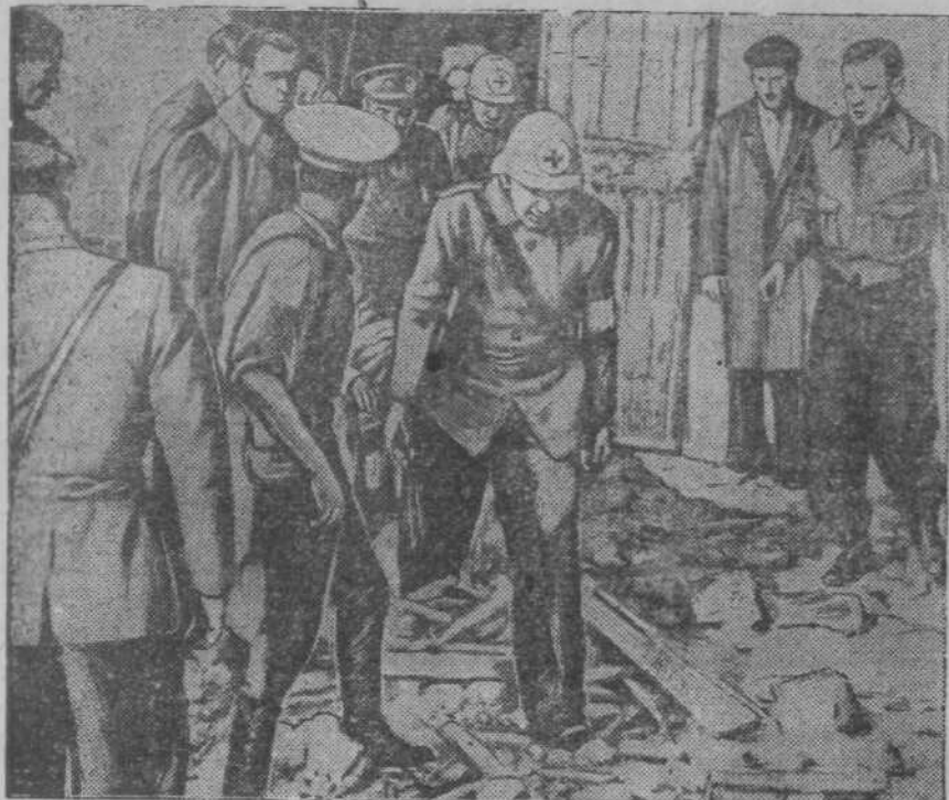
Бомбардировка гор. Барселены фашистской авиацией. На снимке: после бомбардировки санитарные отряды спешат оказать помощь раненым.