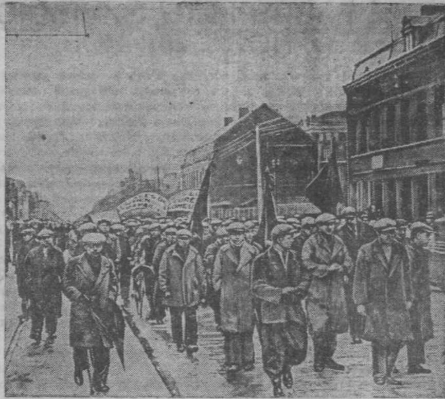
30 ноября — в день всеобщей забастовки во Франции, тысячи бастующих рабочих приняли участие в демонстрациях протеста против чрезвычайных декретов. На снимке: бастующие металлурги завода Эско на демонстрации. Фотохроника.

Совет министров принял сегодня новое постановление, направленное против евреев. Согласно этому постановлению все принадлежащее евреям недвижимое имущество, в том числе промышленные и торговые предприятия подлежат регистрации и оценке. Все, что по оценке превышает установленный фашистским законом лимит, подлежит продаже специально организованной государственной организации, т. е. иными словами будет попросту отобрано.