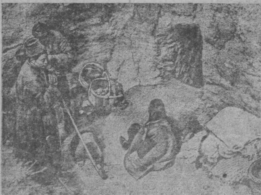
К военным действиям в Китае. На снимке: в таких рвах и канавах приходится ютиться китайскому крестьянству, выброшенному варварскими бомбардировками японских интервентов из родных деревень.