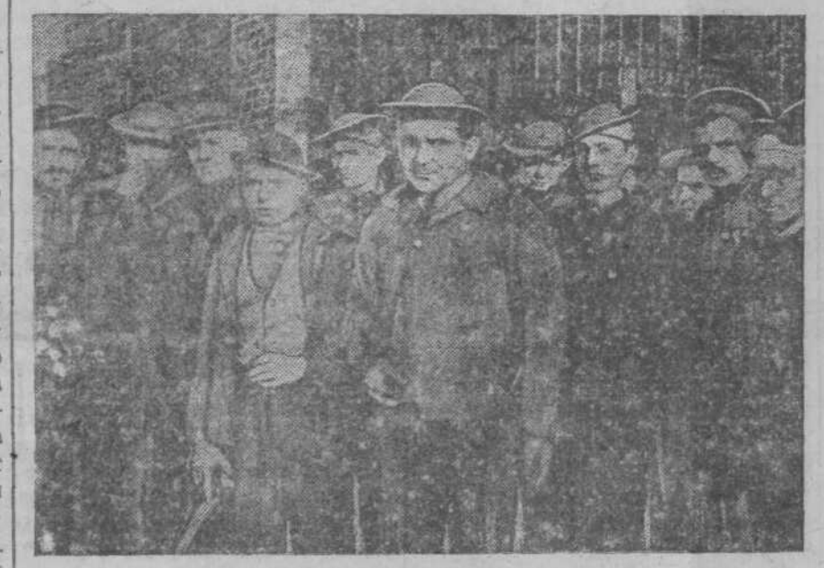
Борьба французского пролетариата против чрезвычайных десантов. Забастовка в Анзене, крупном центре каменистоугольной промышленности Франции. В забастовке участвовало 100 тысяч горняков и рабочих металлургических предприятий. На снимке: пикет бастующих горняков у входа в шахту.

кого огромного недовольства английской общественности по поводу проводимого правительством курса внешней политики. Далее Черчилль высказался за необходимость проведения такой внешней политики, которая объединила бы все общественные слои английского населения. «Все силы, способные оказать сопротивление агрессии фашистских диктаторов, должны объединиться», — добавил Черчилль. — Англия должна вести борьбу за сохранение всеобщего мира вместе с другими миролюбивыми державами. Мы должны пойти еще дальше, не ограничиваясь только национальным объединением и укреплением своей национальной безопасности. Должен быть создан такой высший международный трибунал, который будет охранять международный правовой порядок и который будет способен заставить государство подчиняться законам международного права. Нисколько не отказываясь от того, что осталось от Лиги наций, мы должны заявить о нашей решимости облечь ее большей властью и дать ей всоруженную силу с тем, чтобы Лига могла заставить всех уважать ее решения». «Этот год, — заявил в заключение Черчилль, — был годом таких бедствий и унижений, которых Англия не знала на протяжении многих поколений. В 1939 году Англия и Франция могут оказаться перед лицом еще более серьезной опасности».