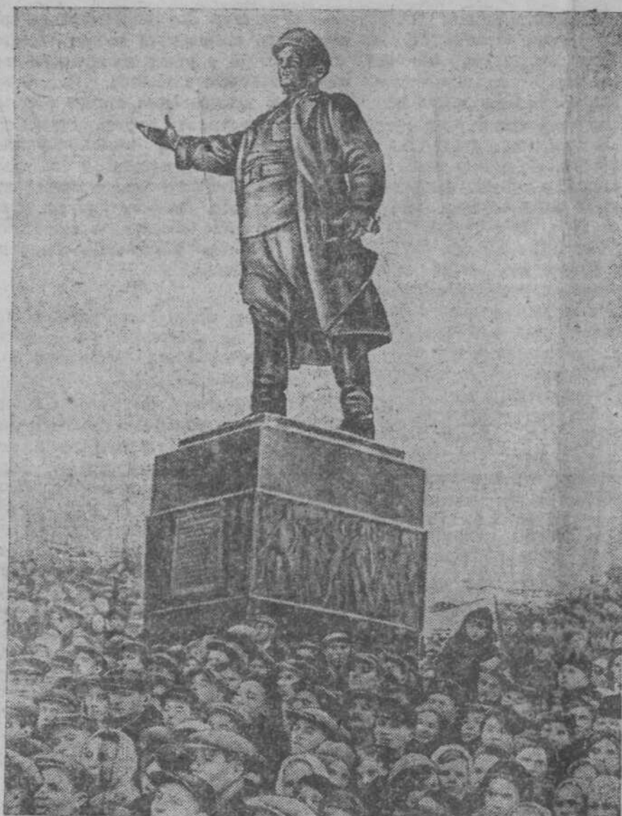
Открытие памятника С. М. Кирову на Кировской площади в Ленинграде 6 декабря 1938 г.