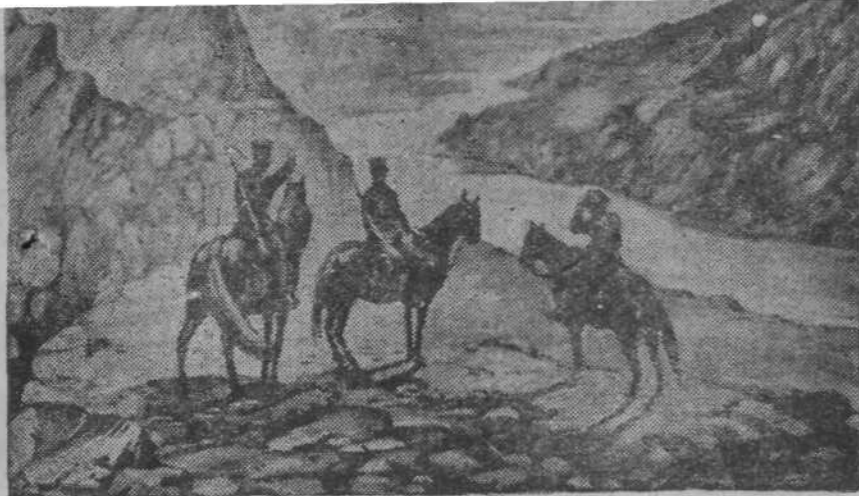
Грузинские художники готовятся к приближающейся XX-й годовщине Рабоче-Крестьянской Красной Армии. Молодой грузинский художник Г. И. Джорджадзе к XX-й годовщине закончил новую картину «Красная Армия на страже советской границы». На снимке: картина художника Г. И. Джорджадзе «Красная Армия на страже советской границы».