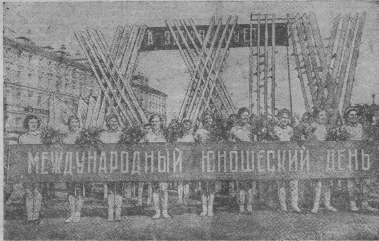
Демонстрация в гор. Москве 6 сентября 1938 года, посвященная XXIV Международному юношескому дню. На снимке: головная колонна спортивного общества КИМ на площади Революции.

В соответствии с новыми задачами должна быть построена и мас-