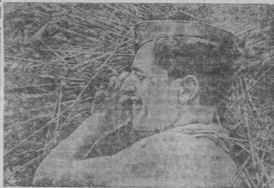
В республиканской Испании. На снимке: боец республиканской армии во время перерыва между боями помогает крестьянам Каталонии в уборке урожая.

вокального комитета, что без масс, без актива они ничего не сделают. Надо работать с активом, растить его, выковывать из него советских руководителей. А этот актив и есть депутаты райсовета, секции, уличные комитеты. М. ЛАЗАРЕВ.