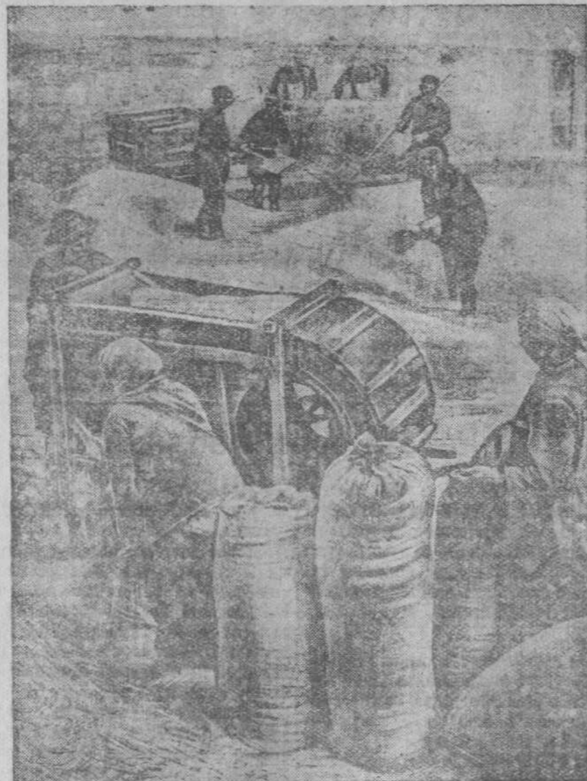
На току колхоза «Красное знамя».

В совхозе большой удельный вес в полеводстве занимают овощи. Надлежащая забота должна быть уделена уборке овощей, но совхоз не готов к этому. До сих пор не подготовлены к приемке овощей овощехранилища. Все хранилища разрушены.