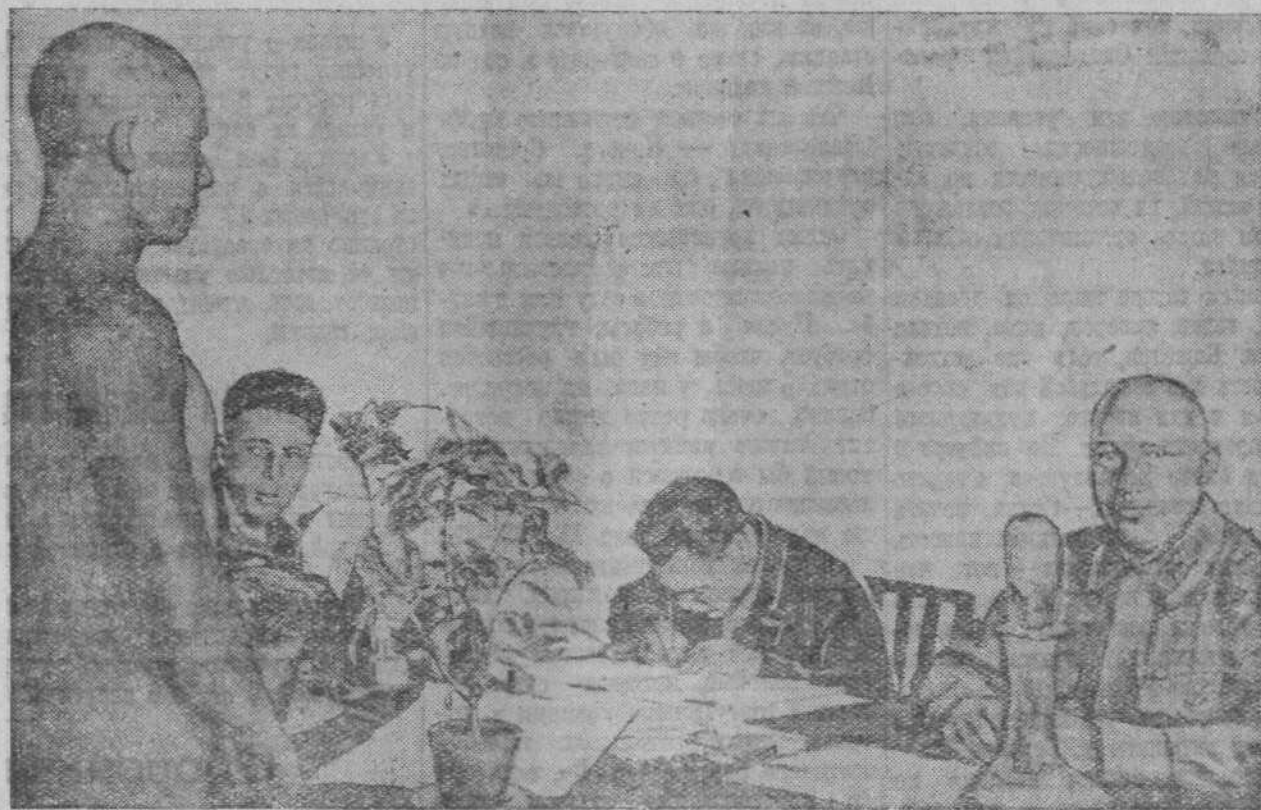
На призывном пункте № 1. На снимке: призывная комиссия за работой (г. Сталинск).