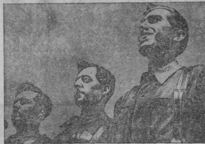
В республиканской Испании. На снимке: молодые летчики республиканского воздушного флота.