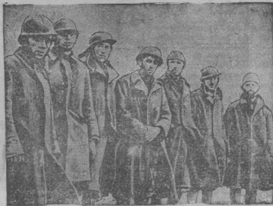
На снимке: итальянские солдаты, взятые в плен правительственными войсками на фронте Гвадалахары. (С фотото).

ПАРИЖ, 7 апреля. Вечерние газеты помещают телеграмму из Андухара о блестящей операции испанских республиканских войск по дороге близ Вильярта (к югу от Пособланко). В телеграмме указывается, что мятежники были вынуждены бежать в беспорядке, и республиканские войска продвинулись на 7 километров, заняв горный проход Чалатравено. Занятие Чалатравено обеспечивает республиканским войскам весьма выгодные