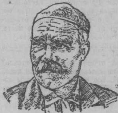
А. С. НОВИКОВ-ПРИБОЙ

24 марта советская общественность отмечает 60-летие одного из виднейших деятелей русской литературы, замечательного советского писателя Алексея Сильича Новикова-Прибоя.