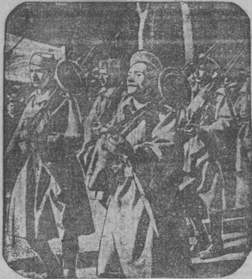
Парад народной армии в Барселоне. В начале марта парадом народной армии закончилась «военная неделя», которая была проведена в Барселоне по предложению рабочих местного завода «Дженерал моторс». На снимке: слушатели военной академии проходят по улицам Барселоны.

22 марта, в 22 часа, было опубликовано коммюнике комитета обороны Мадрида. В коммюнике говорится, что на гвадалахарском фронте республиканцы продолжали наступление и достигли всех намеченных пунктов. В некоторых районах республиканцы вошли в соприкосновение с противником, который оказал слабое сопротивление. Продолжается учет военных трофеев. Правительственная авиация предпринимала разведку для того, чтобы обеспечить безопасность передвижения республиканских войск. На сторону республиканцев продолжают переходить много солдат из вражеского лагеря. (ТАСС).