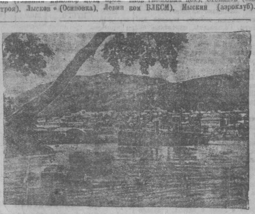
Камчатский полуостров — богатейший край Страны Советов. В водах Камчатки залегают ценные ископаемые, в камчатских лесах много пушного зверя, водоемы полны рыбы. Дачники, глухой в прошлом Камчатский полуостров за годы советской власти превратился в крупный лесной и рыбо-промышленный центр Советского Союза. На снимке: Петропавловск-Камчатка. Вид с Николаевской сопки.

Все выступавшие единодушно одобряли исключение из партии Бухачица и Рыкова за их антипартийную, предательскую деятельность, направленную к восстановлению капитализма в нашей стране.