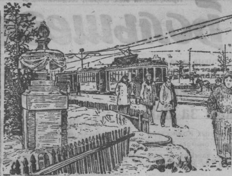
Проспект им. Молотова. На остановке трамвая у 12-й школы.