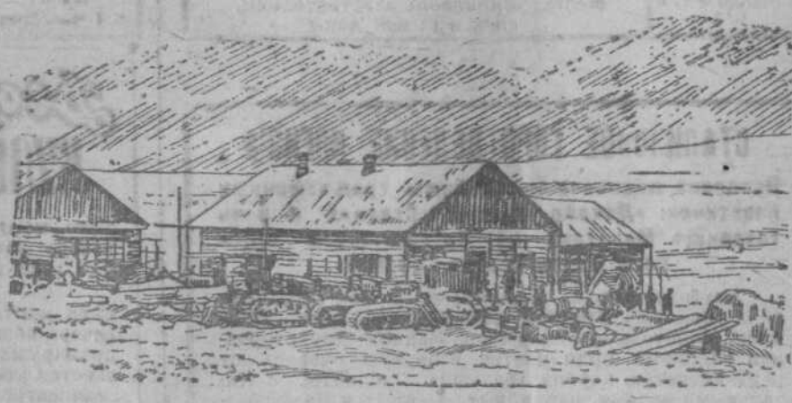
Самая северная полярная станция в мире, построенная советскими полярниками на о. Рудольфа — самом северном острове советского сектора Арктики. Теперь здесь вырос целый городок — удобные жилища, в которых живет 20 зимовщиков, электростанция, радиостанция. Емкая и даже светлый двор. На снимке: полярная станция на острове Рудольфа под первым снегом в сентябре 1936 г. (Союзфото).