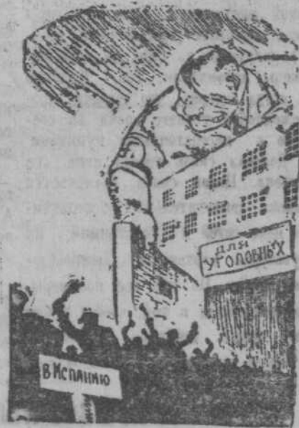
«Добровольцы» пташки из фашистской клетки. Рис. худ. Я. Меломеда

Германия отравила заключенных в тюрьмах угловых преступников в качестве добровольцев для армии Франко. (Из газет).