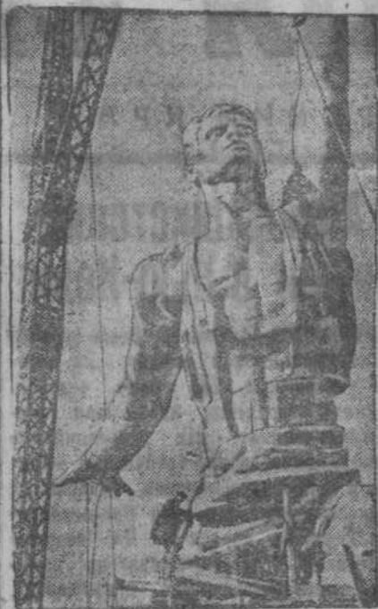
В Москве заканчивается работы по сборке гигантской скульптурной группы (на изображении справа), которая будет установлена на 33-метровой башне с ветского павильона на Парижской международной выставке «Искусства и техника в современной жизни». Идея украсить советский павильон монументальной скульптурой принадлежит архитектору Иосифу Альтеру скульптору В. Мухому. На снимке: сборка 25-метровой скульптурной группы для советского выставочного павильона.

Заключительную часть своего доклада товарищ Хрущев посвя-