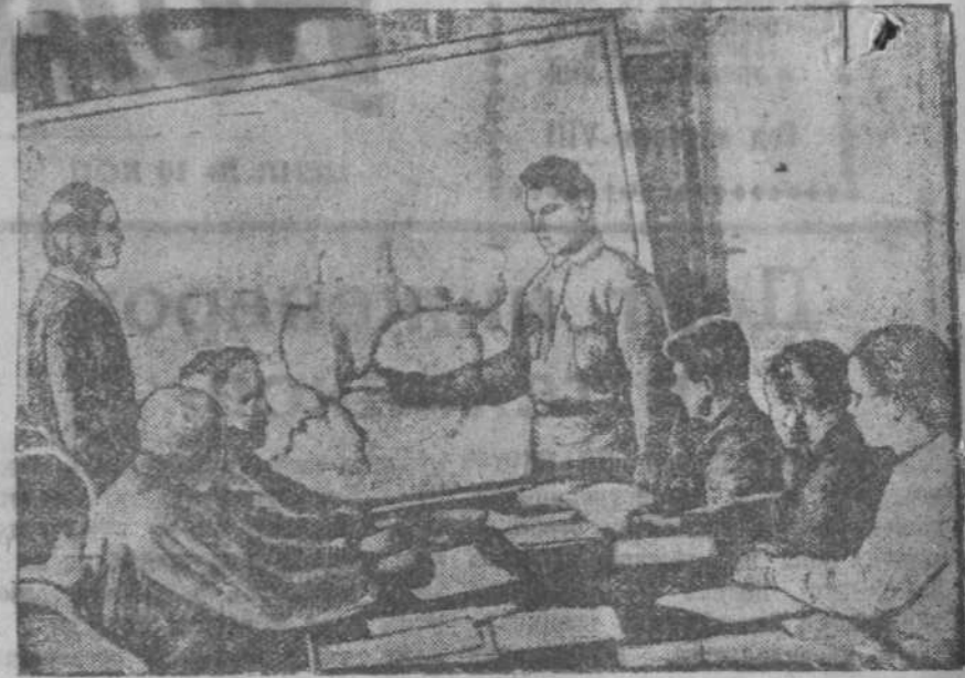
Сталинский горком ВКП(б) организовал краткосрочные курсы для сельских коммунистов. Программа курсов: изучение доклада товарища Сталина на Чрезвычайном VIII-м Съезде Советов, Конституция СССР и решений февральского Пленума ЦК ВКП(б). На снимке: занятия курсов сельских коммунистов.

же детский дом. Тысячи политических эмигрантов и их семей получили через МОПР СССР необходи-