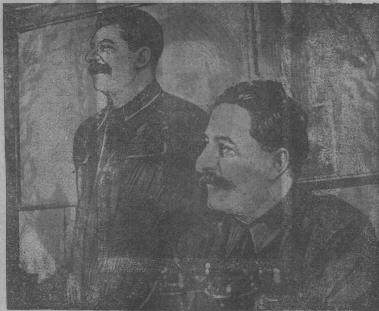
Товарищи Сталин и Орджоникидзе

Жизнь этого кристально-чистого, непоколебимого революционера-большевика — пример для трудящихся всего мира, борющихся за социализм, за свое освобождение. Любимец советского народа, Серго Орджоникидзе с юных лет отдал свое сердце, ум, силы, неисчерпаемую энергию, всего себя, всю свою жизнь делу рабочего класса, делу коммунизма. Вся его жизнь прошла на глазах партии, на глазах рабочего класса под руководством Ленина — Сталина, ЦК ВКП(б).