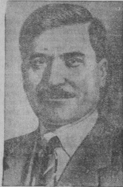
Тов. В. Я. Чубарь.

партийному и непартийному большевику. (Бурные аплодисменты). Овладевать большевизмом — это прежде всего быть безгранично преданным делу трудящихся, делу партии Ленина — Сталина, безгранично пре-