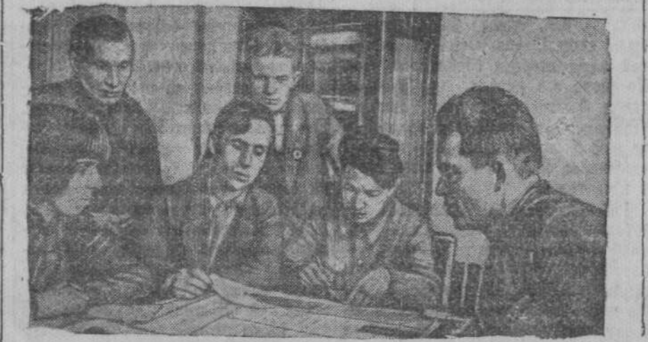
На снимке: редколлегия стенгазеты «За огнеупор» шмото-дыпасового цеха готовит номер газеты, посвященный выборам в Верховный Совет СССР.