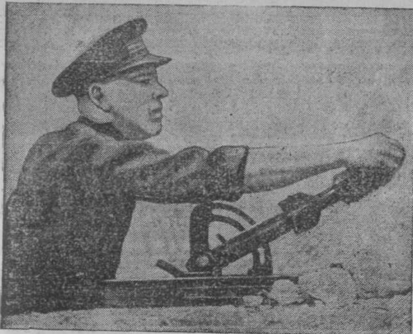
На фронтах в Испании. На снимке: боец республиканской Испании у окопной пушки (район Сарагоссы).