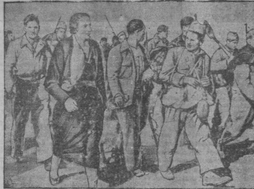
В республиканской Испании. На снимке: Долорес Ибаррури (Пассионария) среди республиканских бойцов на центральном фронте.

В секторе Вальсекалья (на запад от Пособаданко) республиканцы заняли первые линии позиций мятежников. Мятежники пытались безуспешно атаковать позиции, недавно занятые республиканскими войсками в Сиерра Техонера и Сиерра Мульва. Мятежники предприняли атаку на позиции республиканцев у Альдеа де Куэнка и у Гранха д Терреармоса. Эти атаки были по всей линии отражены республиканскими войсками.