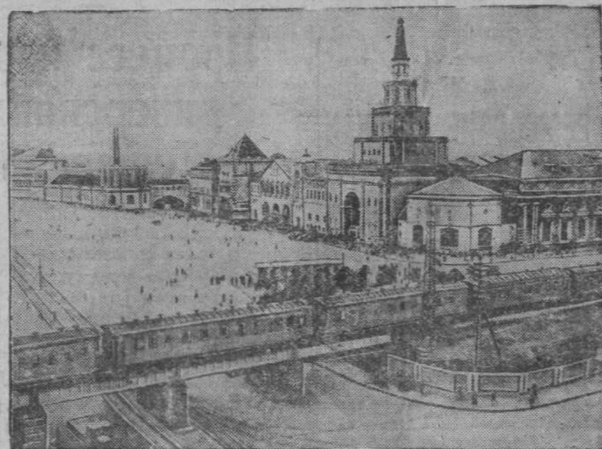
Новая Москва. На снимке: общий вид реконструированной Комсомольской площади. Справа—Казанский вокзал.