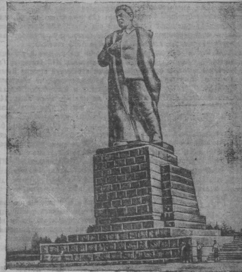
На канале Москва—Волга установлены гигантские монументы Ленина и Сталина. Автор монументов—скульптор С. Меркуров. На снимке: монумент И. В. Сталина.

Газета «Синчжунжао» в комментариях по этому поводу пишет: «В тот момент, когда вся страна объединяется в борьбе против смертельного врага, в борьбе за свое существование, подлая кучка китайских троцкистов пользуется отправкой войск на фронт для заговора в тылу. Не ясно ли, не чьим указаниям и в пользу кого направлены эти деяния троцкистов. Страна не может и не должна терпеть этих шпионов и предателей. Во имя будущего нашей нации в интересах сопротивления агрессору троцкистские шпионы и предатели должны быть уничтожены».