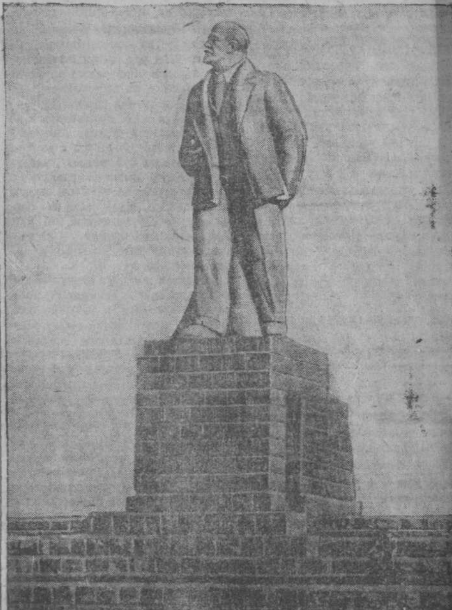
На канале Москва—Волга установлены гигантские монументы Ленина и Сталина. Автор монументов—скульптор С. Меркуров. На снимке: монумент В. И. Ленина.

Агентства Гоминь сообщает, что части 8-й китайской армии под командованием Чжу Дэ и части 84 дивизии генерала Гао Гуй-цзе нанесли новое поражение японским войскам в провинции Шаньси.