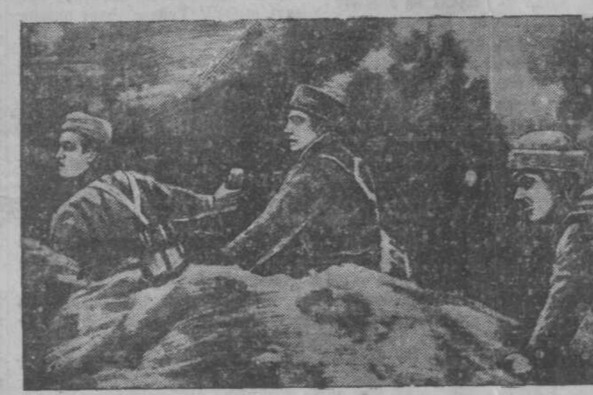
На снимке: динамитчики республиканской армии в Испании на линии огня.

С заключительной речью на съезде выступил Марселл Капан