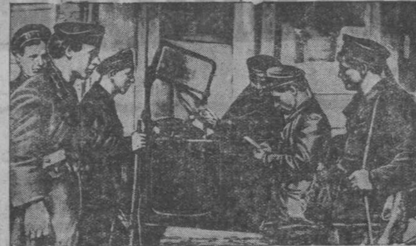
20 лет назад. В дни Великой Октябрьской социалистической революции. На снимке: проверка пропусков у проезжающих в автомобиле в Петрограде. (1917 год).