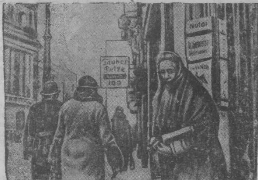
Муж зарабатывает мало—нехватает на жизнь. Она вышла на улицу может быть удастся немного подработать продажей спичек?

Радостна и счастлива жизнь советского народа, встречающего XX-ую годовщину Великой Октябрьской социалистической революции грандиозными успехами в строительстве социализма. Под знаменем Сталинской Конституции деятельно готовится советский народ к выборам в Верховный Совет СССР. Радостная и счастливая жизнь советских людей составляет резкий контраст с положением трудящихся в капиталистическом мире. Особенно мрачна и безотрад-на жизнь народных масс в странах фашизма. Хозяинчанье германских фашистов обрекает широкие народные массы на голодную, бесправную и беспросветную жизнь. Квалифицированные рабочие, инженеры, талантливые мастера и искусства тщетно пытаются найти применение своим способностям. Они обречены на нищету и недоедание, они лишены жилища, лишены всех радостей жизни.