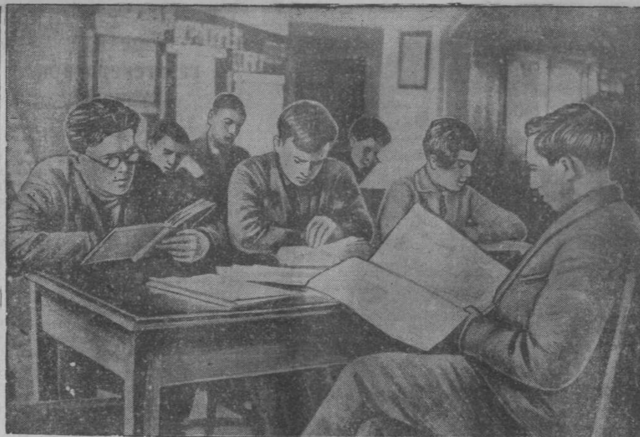
В читальном зале городской библиотеки.

ж) Образовать в составе Иркутской области Усть-Ордынский и Бурят-Монгольский национальный