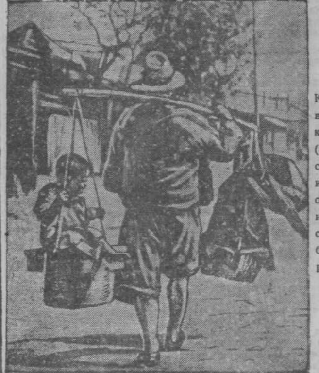
К военным действиям в Китае. На снимке: китайский беженец (г. Шанхай) пытается спасти своего ребенка и свой скудный скарб от японских снарядов и пуль, спеша добратся до сравнительно безопасного международного селения.

Корреспондент указывает, что бомбы, сброшенные на станцию Хуанша, разрушили много домов. Во время бомбардировки на станции было много народа.