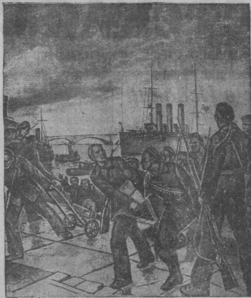
20 лет назад. Десант моряков с «Авроры». С картины худ. Шухмина. (Музей революции СССР).

Партийная, комсомольская и проф. Такие кружки, изучающих избира-