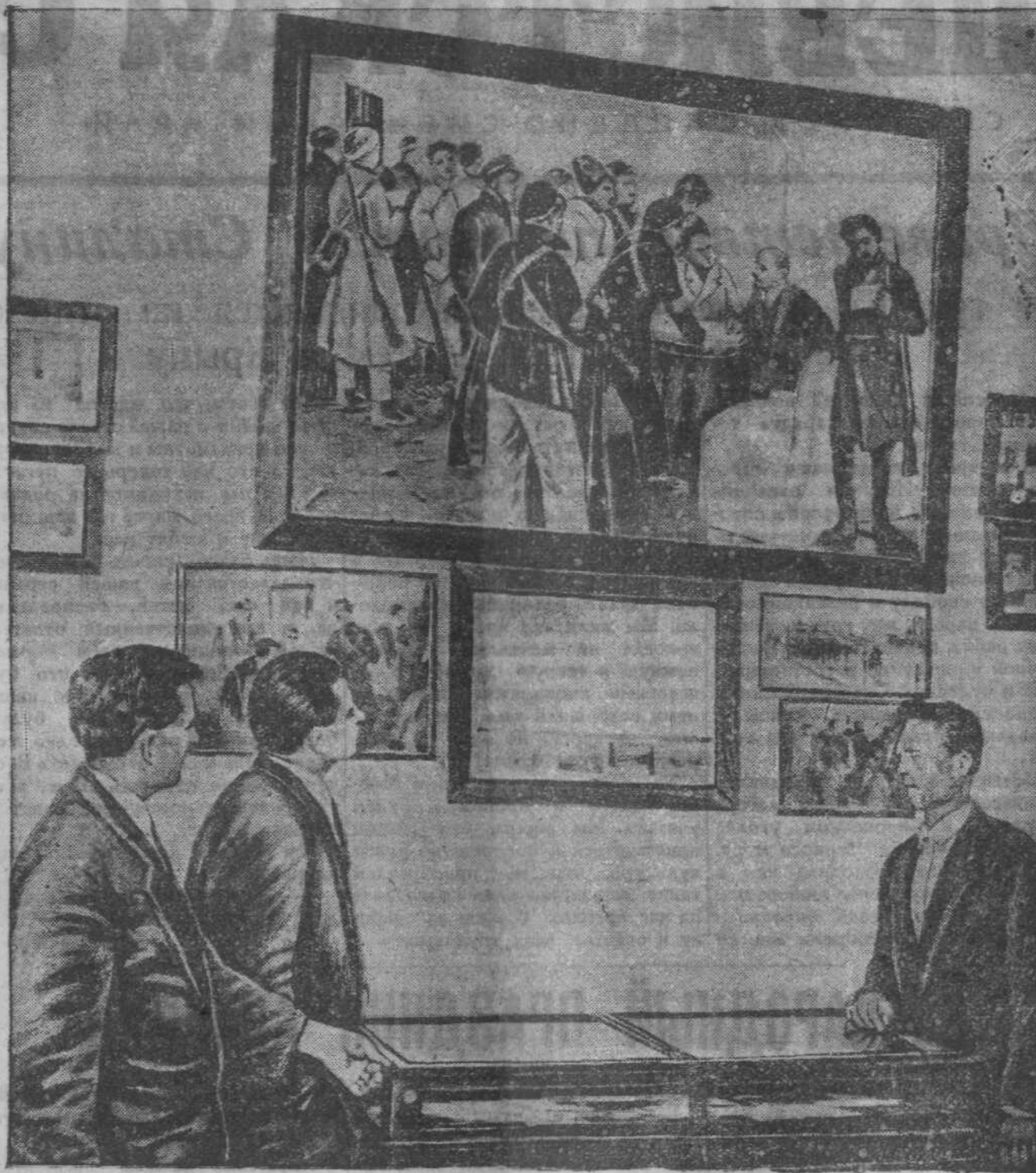
В парторганизации активно изучаются материалы VI съезда большевистской партии. К двенадцатилетнему съезду парткабинет горкома ВКП(б) организовал выставку документов и фотографий. На снимке: уголок выставки.

желанием о дополнительном проведении конференции по вопросу разъяснения «Положения о выборах в Верховный Совет СССР» и о прикреплении к домохозяйкам, имеющим малолетних детей, на квартиры культурмейцев, что-