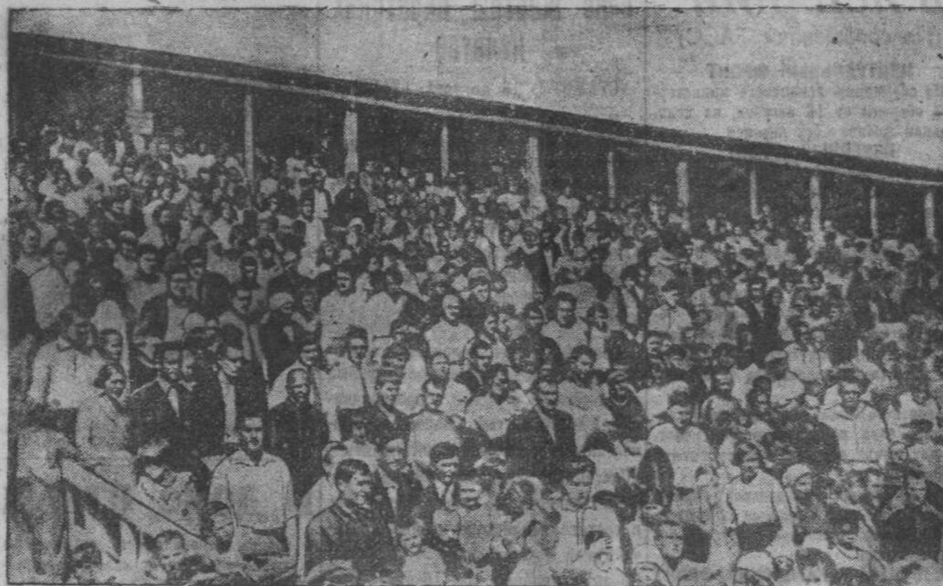
День авиации в Сталинске. На снимке: митинг трудящихся города на стадионе металлургов.