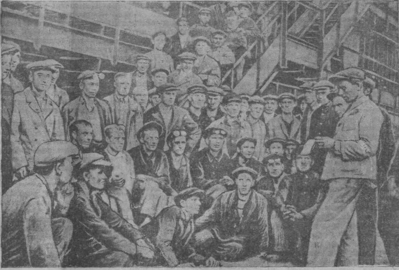
По почину сталеваров 2-го мартеновского цеха, на заводе развернулось соревнование за выполнение годового плана к XX годовщине Октябрьской революции. На снимке: собрание 3-й бригады 2-го мартеновского цеха обсуждает условия соревнования.