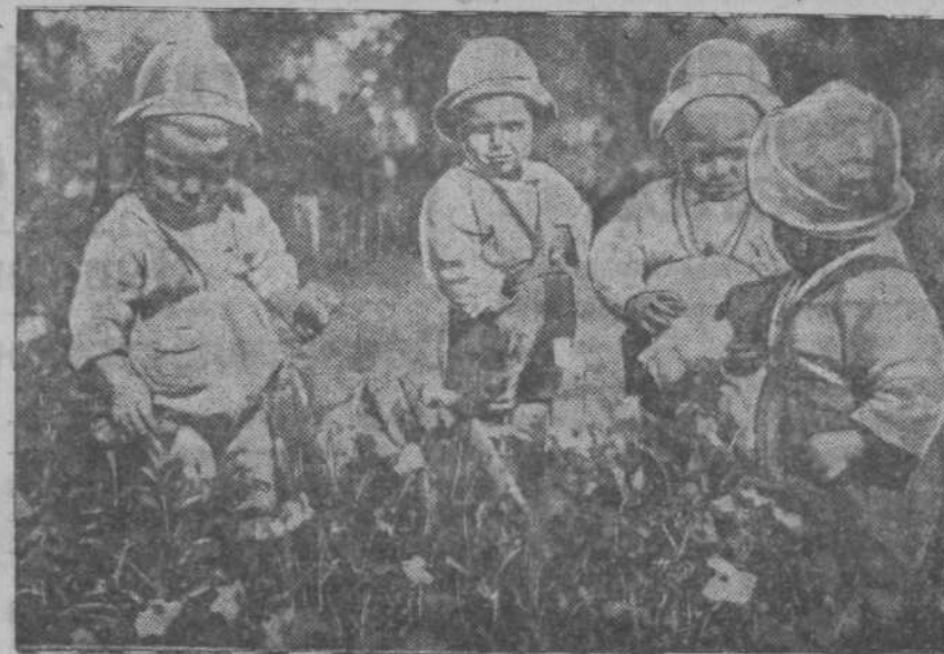
Воспитанники детсадов имени 1-го мая у цветочной клумбы.