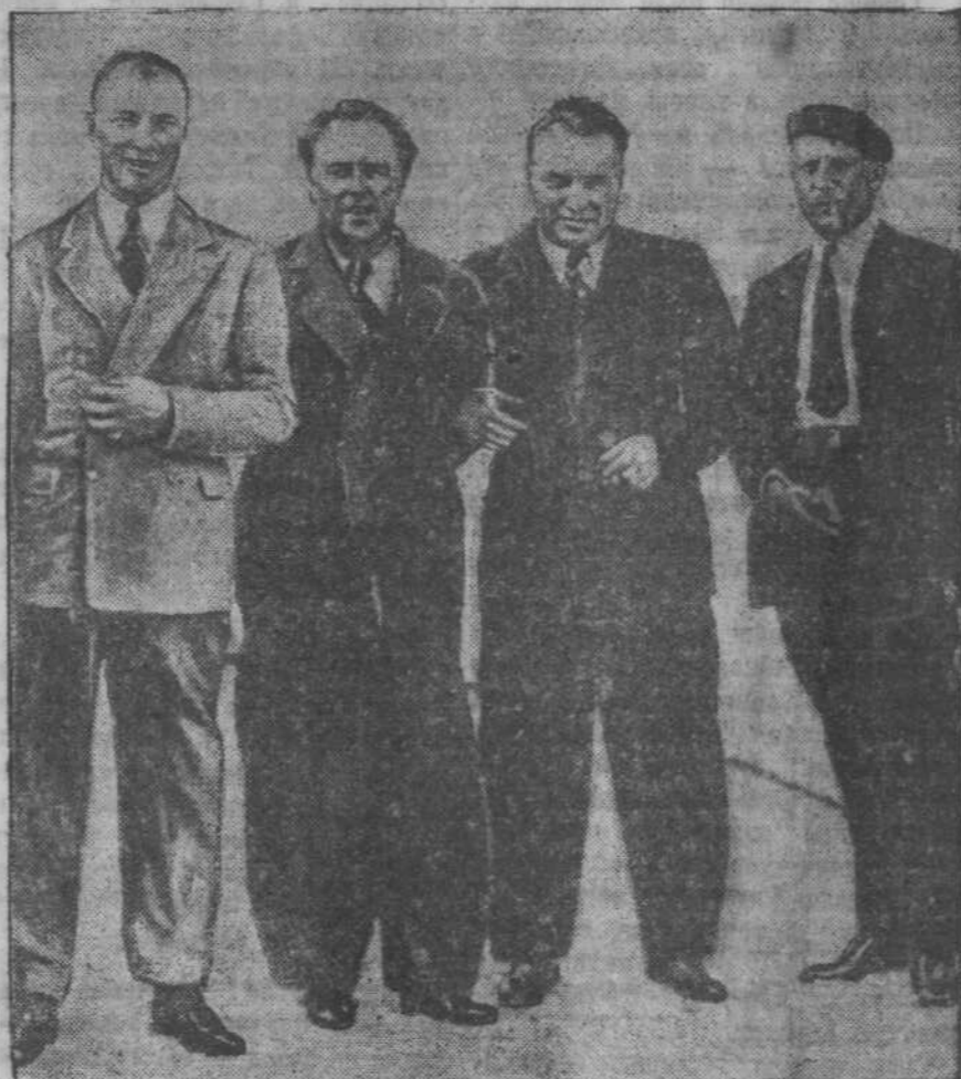
Товарищи Чкалов, Беляков и Байдуков на международной выставке в Париже. На снимке: (справа налево) гг. Байдуков, Чкалов, Вайян Кутюрье и Беляков на террасе павильона прессы.