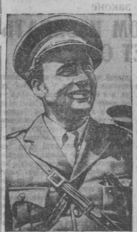
На снимке: Популярнейший полководец республиканской армии Испании командир дивизии Эрик Листер.

...иногда партийность, умение затронуть самое главное, современное, то, чем живут и дышат массы, то, что является в данный момент с политической точки зрения наиболее значимым. Разве не является прекраснейшим материалом для работы массовиков и агитаторов богатейший урожай, получаемый в этом году во всех районах страны? Разве не следует развернуть подлинно массовую политическую работу вокруг начинающегося распределения доходов? Большевик-агитатор использует эти факты для того, чтобы показать успехи социализма в нашей стране, для того, чтобы показать заботу партии и лично товарища Сталина о зажиточной жизни колхозных масс. Немало было в прошлые годы «агитаторов», замаскированных врагов, которые убеждали колхозников незаконно и вопреки уставу отдать большую часть полученных доходов на строительство, в неделимые фонды и т. д. И находились партийные руководители, которые записывали себе в актив отказ колхозников от значительной части своих доходов. Такая практика ничего общего не имеет с линией партии. Наша задача состоит в том, чтобы неуклонно, проводя в жизнь устав сельскохозяйственной артели, дать колхознику возможность наиболее полно воспользоваться плодами колхозного строя, дать ему почувствовать всю силу колхозов, несущих крестьянину обилие продуктов, зажиточную и культурную жизнь. Это должны понять и помнить большевики-агитаторы, массовики.