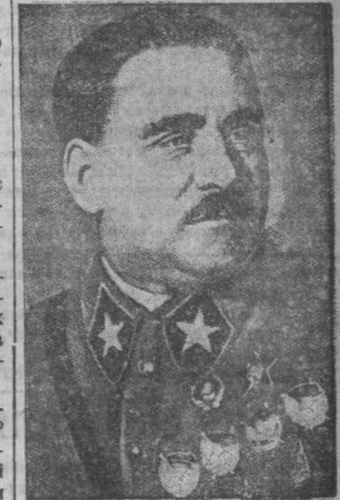
Маршал Советского Союза тов. В. К. Блюхер.

Особая с огромным воодушевлением встретила Сталинскую Конституцию. Митинги, собрания, беседы прошли всюду, где только живут, учатся, охраняют границы бойцы ОКДВА. Раненые бойцы-по-