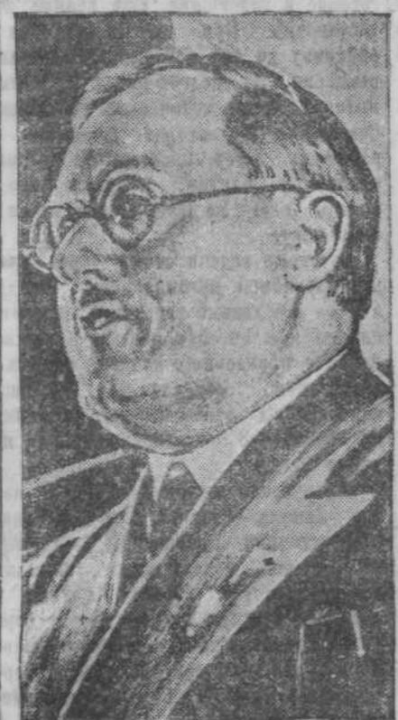
Тов. А. Я. Вышинский.

земного населения на рудниках, начале завоевания и разграбления Ост-Индии, превращение Африки в заповедное поле охоты на чернокожих—такова была утренняя заря капиталистической эры производ-