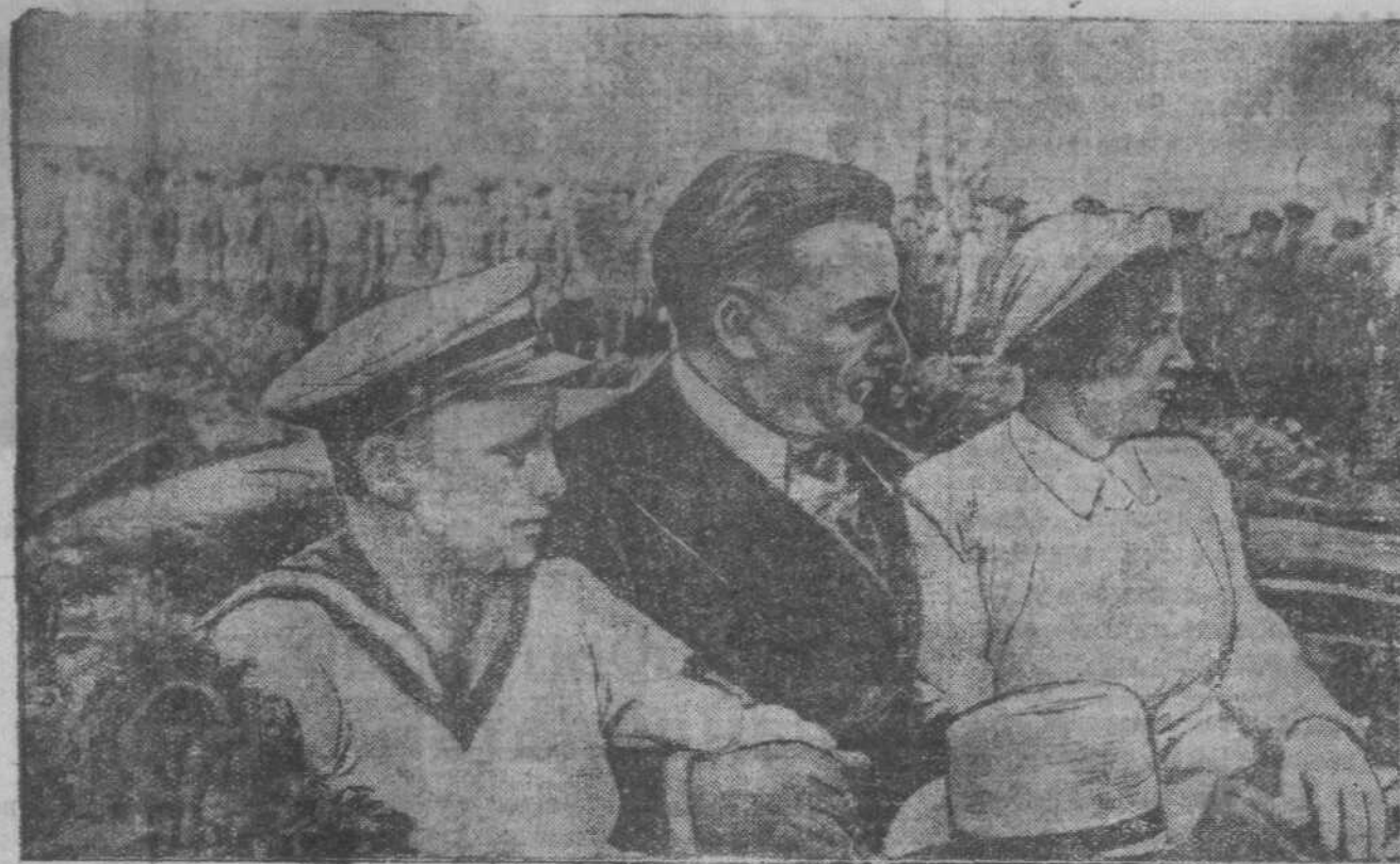
26-го июля в Москву возвратились Герои Советского Союза гг. Чкалов, Байдуков и Беляков — участники беспримерного в истории авиации героического перелета Москва — Северный полюс — Соединенные Штаты Америки. На снимке: Герои Советского Союза тов. Чкалов с женой и сыном по пути с площади Белорусского вокзала в город.

Японские военные корабли находятся сейчас не только в Сятоу, Амое и Фуцжоу, но и в ряде других мелких портов Китая. Японский флот, расположенный на Формозе, в полной боевой готовности на случай крупного китайско-японского