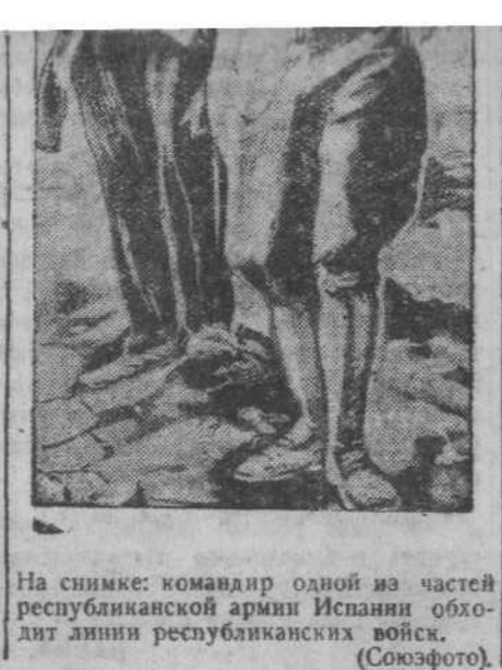
На снимке: командир одной из частей республиканской армии Испании обходит линии республиканских войск.

на других фронтах. Если верно наше утверждение, что мы ведем войну за независимость, то еще более верно лозунг, выдвинутый нашей партией в первые же дни борьбы: лишь создание регулярной армии может привести к победе. Сегодня этой армией гордится республиканская Испания. Республиканская Испания гордится высоким наступательным и победным духом этой армии, которую руководят преданные делу народа начальники. Год войны открывает нашему народу перспективы победы, которая не будет легкой. Эта победа будет достигнута в результате крупных сражений, уже начавшихся на центральном фронте и требующих от всех пламенного энтузиазма, огромных жертв и железной воли.