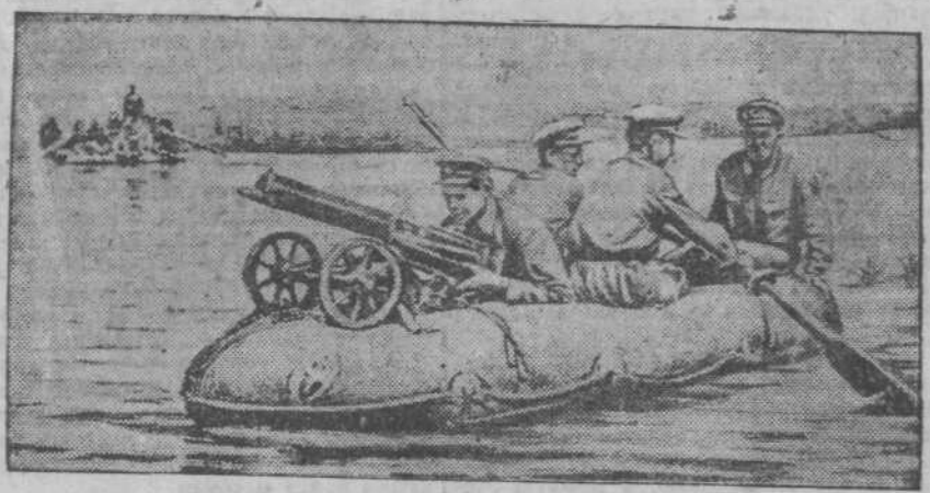
На тактических занятиях в Н-ских лагерях. На снимке: переправа пулеметного отделения через реку.

Да здравствует наш великий и мудрый вождь и учитель, наш беззаветно любимый Иосиф Виссарионович Сталин!