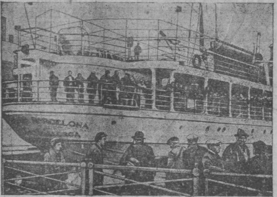
30 мая подводная лодка фашистских пиратов потопила испанский пароход „Сиудад де Барселона“, на борту которого находилось 300 пассажиров, следовавших из Марселя. Погибло 50 человек, много раненых. На снимке: пароход „Сиудад де Барселона“. (Снимок сделан во время пребывания судна в Марселе).

ТОКИО, 12 июня. (ТАСС). По сообщению агентства Домей пу-