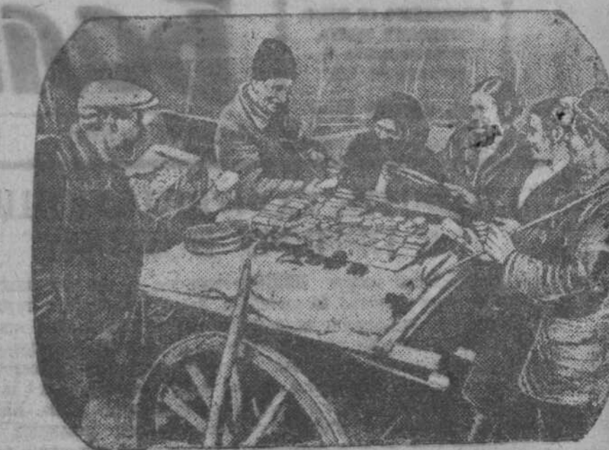
Во время весеннего сева потребительская кооперация организовала в таборах колхоза «Трудовик» (Давулиновского района, Вышневолоцкой области) торговлю товарами широкого потребления. На снимке: передвижной ларек в поле.