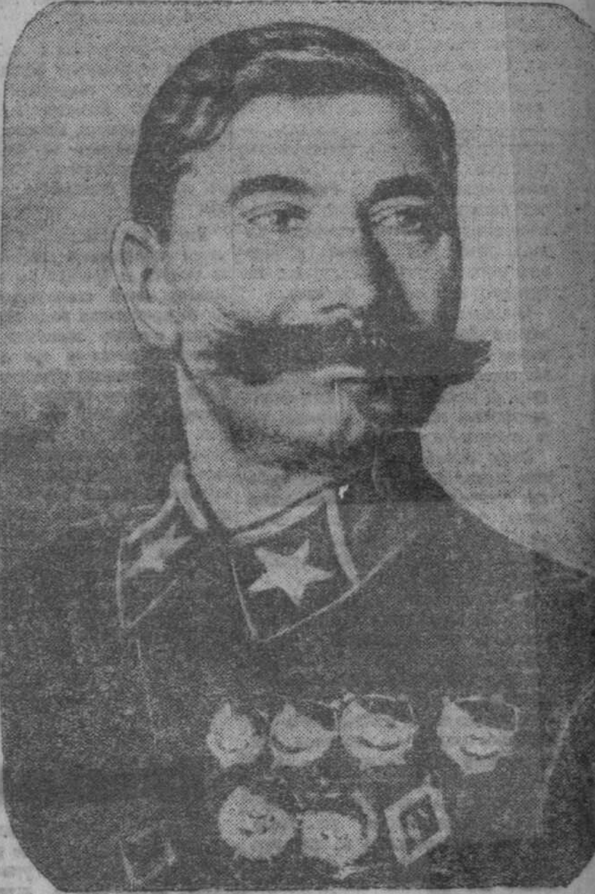
Мероприятию Советского Союза с М. Буденному исполнилось 54 года (См. фото).

Шевельевский колхоз «Красный Воробей» инициативы лозунги, плакаты. В 1 мая в этом колхозе организационно вывешивают инициативы. 1 мая инициативы в клубе вывешивают инициативы инициативы.