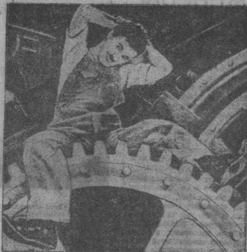
Государственное управление кино-фотопромышленности (ГУКФ) приобрело фильмы знаменитого американского кинорежиссера и режиссера Чарльза Чаплина «Огни большого города» и «Новые времена». На снимке: кадр из фильма «Новые времена». (Синифото)

ВАРШАВА, 25 апреля. Специальный корреспондент польского полуфашистского агентства «Искра» сообщает из Будапешта, что между Муссолини и Гитлером подписаны два соглашения и договор о выдате преступников. Эти договоры, по словам корреспондента, доказывают систему уже ранее заключенных между Польшей и Венгрией соглашений, а именно: соглашения об арбитраже, воздушную конвенцию и договор об интеллектуальном сотрудничестве. Таким образом, — пишет корреспондент агентства «Искра», — ввиду сужения дружбы возникает польско-венгерских инструментов, регулирующих отношения между Венгрией и Польшей». (ТАСС).