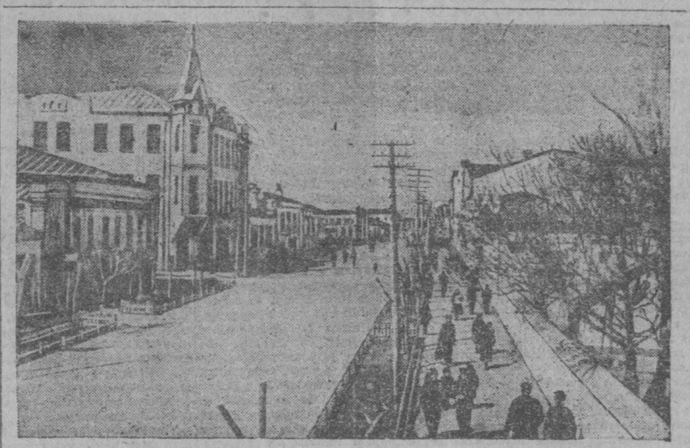
Вывезенный уездный городишко Моэдок (Северо-Кавказский край) славился непроходимой грязью и полуразрушенными деревянными домами. Ныне облик районного центра Моэдок совершенно изменился: улицы покрываются асфальтом и освещены, строятся новые каменные дома, школы и другие культурные учреждения. На снимке главная улица им. Кирова в Моэдике.

Казачьи края восторженно встретили приказ товарища ВОРОШИЛОВА ★ОРДЖОНИДЗЕ, 25 апреля. Вчера во всех отрядах Северной Осетии был приведен «день единения». С раннего утра на вышках за стенами собралась одежда по-чересекски в белых и серых казачьих моделах, «шарки, шкельники». С большой радостью встретили казаки приказ тов. Ворошилова об образовании казачьих территориальных дивизий и введение собой казачьей формы. Лишь поздно пошел вечер. Далеко не спали казаки «ура» в честь вклада павших товарищей Сталина, главной рабочей-арестанской Красной армии и ее железного наркома, маршала Советского Союза товарища Ворошилова. Особенно торжественно праздновали «день единения» казаки станицы Ардонской, где состоялось открытие районного клуба «Ворошиловских заводчиков». На встрече ардонцы поздравили лично товарища Н. Е. Ворошилова. Приветие реченно сегодня 20 апреля в день исторического постановления ЦКЕ СССР об отмене ограничений для казаков при поступлении в РККА, проводится в станице районный праздник казачьей молодежи.