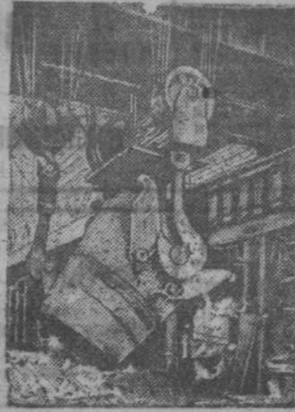
На снимке: баллава втулка в маргеновскую печь.

Шахты должны выполнять свои обязательства перед государством и обществом. Необходимо обеспечить безопасность и эффективность работы шахт.