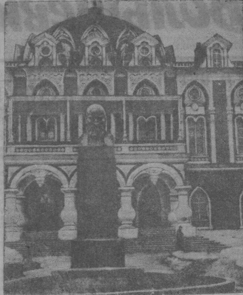
17 марта исполнилось 15 лет со дня смерти проф. Н. Е. Жуковского — отца русской авиации, выдающегося ученого, автора целого ряда работ по механике и математике, особенно многочисленных в областях гидродинамики, аэродинамики и авиации. По мысли проф. Н. Е. Жуковского и при его деятельном участии были основаны Центральный аэрогидродинамический институт (ЦАГИ) и Военно-воздушная академия РККА. НА СНИМКЕ: Военно-воздушная академия имени Н. Е. Жуковского в Москве. Перед зданием памятник Н. Е. Жуковскому, установленный ко дню десятилетия со дня его смерти.