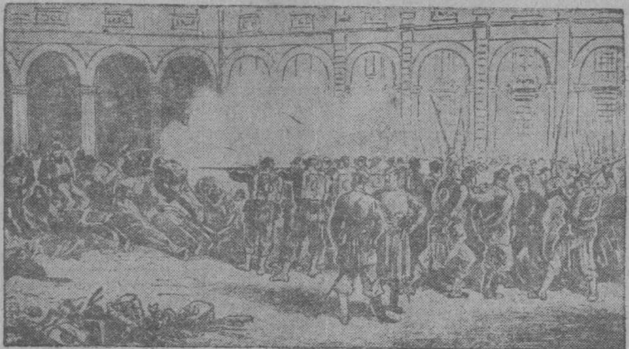
К годовщине Парижской Коммуны. На снимке: расстрел пленных коммунарков во дворе лагеря Лебедево.

одновременно и в неразрывной связи с предложениями Гитлера, касаясь укрепления европейского мира». Фландер заявил, что он предпочтет покинуть Лондон и выехать с сессией Совета Лиги наций, нежели участвовать в обсуждении вопроса в этих условиях, выдвинутых германским правительством.