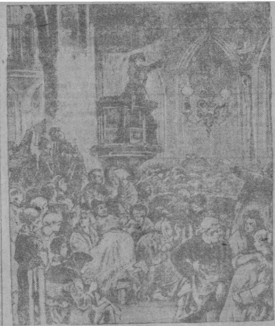
На снимке: заседание женского клуба в парижском Сен-Жермен-Локлеру. По инициативе ЛИКСА («МОНД»).

День за днем он делает свои выписки из буржуазных газет и в двух—трех словах на полях этих выписок отмечает важнейшие факты, противоречия в показаниях противников, в двух—трех словах он выражает свое отношение к тщательно собранному материалу. Борьбная история Коммуны, обуреваемой ненавистью не только французской буржуазии, но всего капиталистического мира, встает перед нами, как живая. Это — уже не