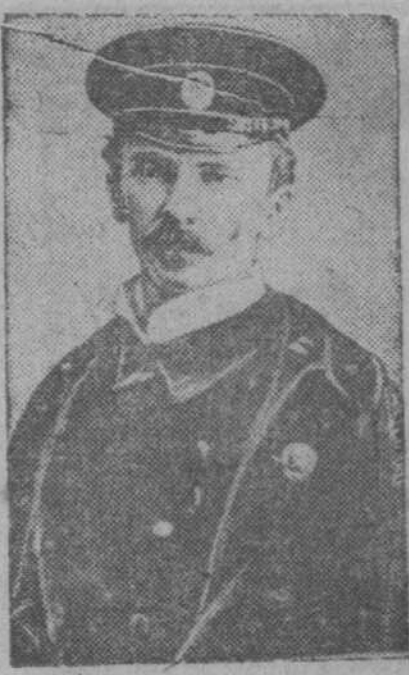
19 марта исполняется 30 лет со дня расстрела лейтенанта Шмидта, стоявшего во главе восстания бронепоезда «Потемкин». НА СНИМКЕ: П. П. ШМИДТ.

он не намерен сотрудничать со странами, где у власти находится большевик. «Мы должны бояться», — пишет Эррио, — что если вы основываете вашу внешнюю политику на борьбе против большевизма, то другие страны, тем самым, имеют право основывать свою политику на борьбе против фашизма и национал-социализма. Французская точка зрения заключается в том, что необходимо уважать внутреннюю политику всех государств». По поводу гитлеровских предложений о 25-летнем пакте с испанцами Эррио напоминает, что Локарнский пакт предусматривал арбитраж и мирное разрешение всех возможных возникших разногласий, между тем Германия приехала к силе, нарушив Локарнский пакт.