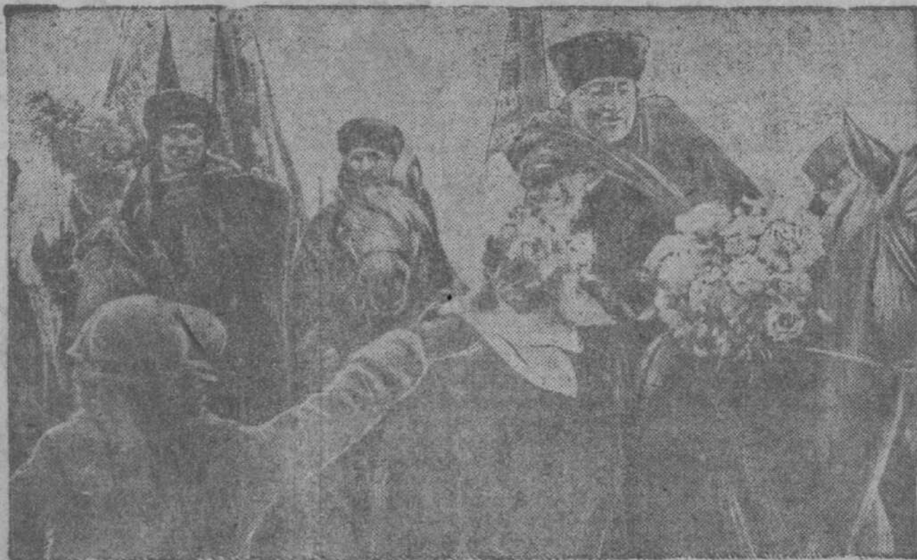
В Пятигорске состоялся финиш отважных джигитов, совершивших на колхозных конях в тяжелых условиях героический пробег вокруг Кавказского хребта расстоянием в 3000 километров. НА СНИМКЕ трудящиеся Пятигорска подносят конникам цветы.

Траурные собрания происходят в научных учреждениях. Особенно шумный митинг состоялся во Всесоюзном институте экспериментальной медицины. Более 500 профессоров и научных сотрудников пришли почтить память гениального ученого, величайшего физиолога наших дней. С личными воспоминаниями выступили ученые-познатели академика — профессора