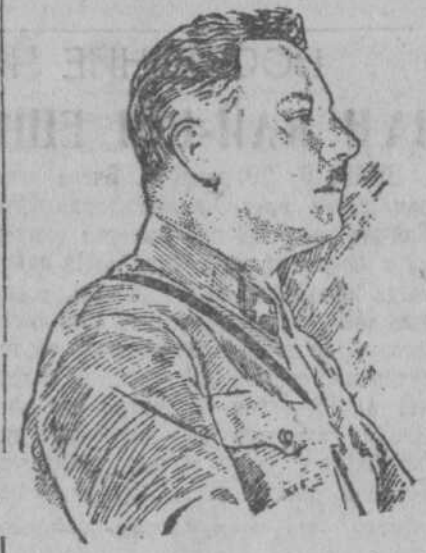
Тов. К. Е. ВОРОШИЛОВ.

Прежде всего, оно открывается в присутствии нашего великого Сталина (бурная, продолжительная овация, весь зал встает) и его ближайших соратников—членов ЦК партии и рабоче-крестьянского правительства. (Бурные аплодисменты). Ваше совещание будет проходить в Кремле, в исто-