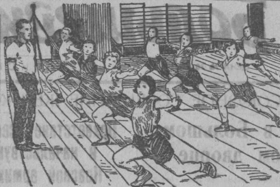
В спортивном зале 12 школы. Урок физкультуры: вольные упражнения из комплекса „ГТО“ второй ступени.

БЕРЛИН, 20 декабря. «АНТ-35», вылетевший из Кельна в 12 часов 5 минут по средне-европейскому времени, прибыл в Берлин в 1 час 30 минут и покрыл таким образом расстояние от Кельна до Берлина в рекордное время — 1 час 25 минут. На борту горячего самолета в 2 часа 30 минут стартовал, вызвав шум на Берлигсберг.