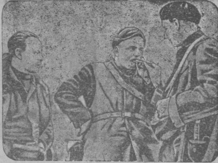
Бойцы интернациональной бригады правительственных войск на мадридском фронте (Союзфото).

Руководящие лондонские газеты по месту на видном месте сообщения