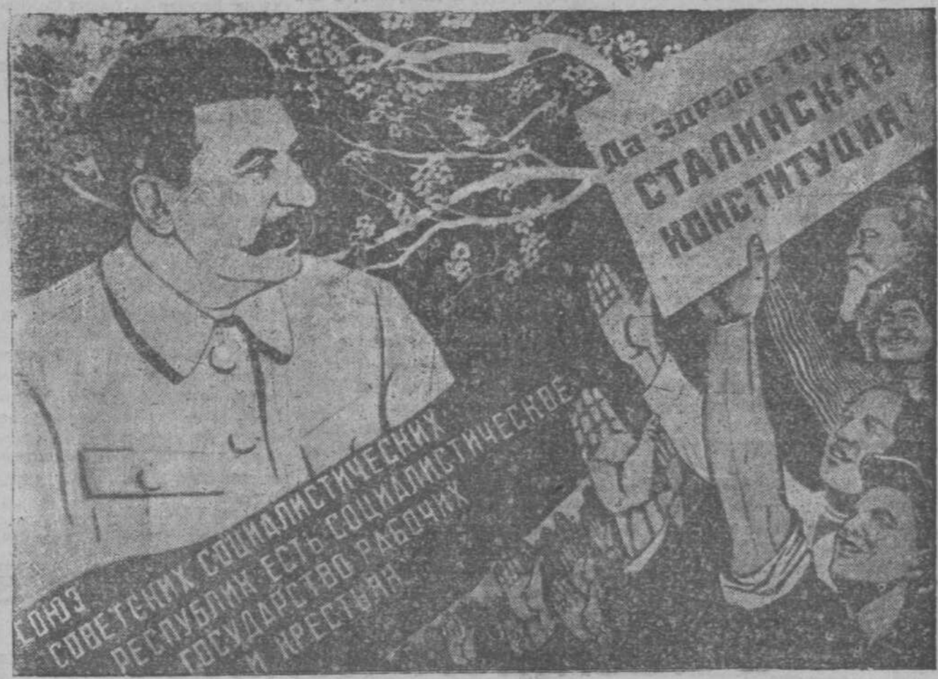
Изюбризм выпущен плакат работы художников Дени и Долгорукова: «Да здравствует Сталинская Конституция!» Этот плакат выйдет также на узбекском, таджикском, казахском, якутском, кара-калпакском и других языках народов СССР. На снимке: плакат работы художников Дени и Долгорукова: «Да здравствует Сталинская Конституция!»

А это значит, что еще больше возрастает необходимость повышения воспитательной и всей работы внутри партийных организаций. Лозунг: «Коммунизм — в центре внимания!» приобретает новую силу. Каждый коммунист становится пропагандистом и проводником новой Конституции, организатором масс на осуществление величайших прав и почетных обязанностей граждан нашей социалистической страны.