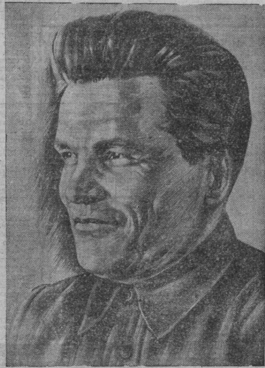
Сергей Миронович Киров

... Могучая воля, неиссякаемый организаторский талант этого человека обеспечивают партию своевременно проведение больших исторических партийных съездов с величайшей ответственностью.