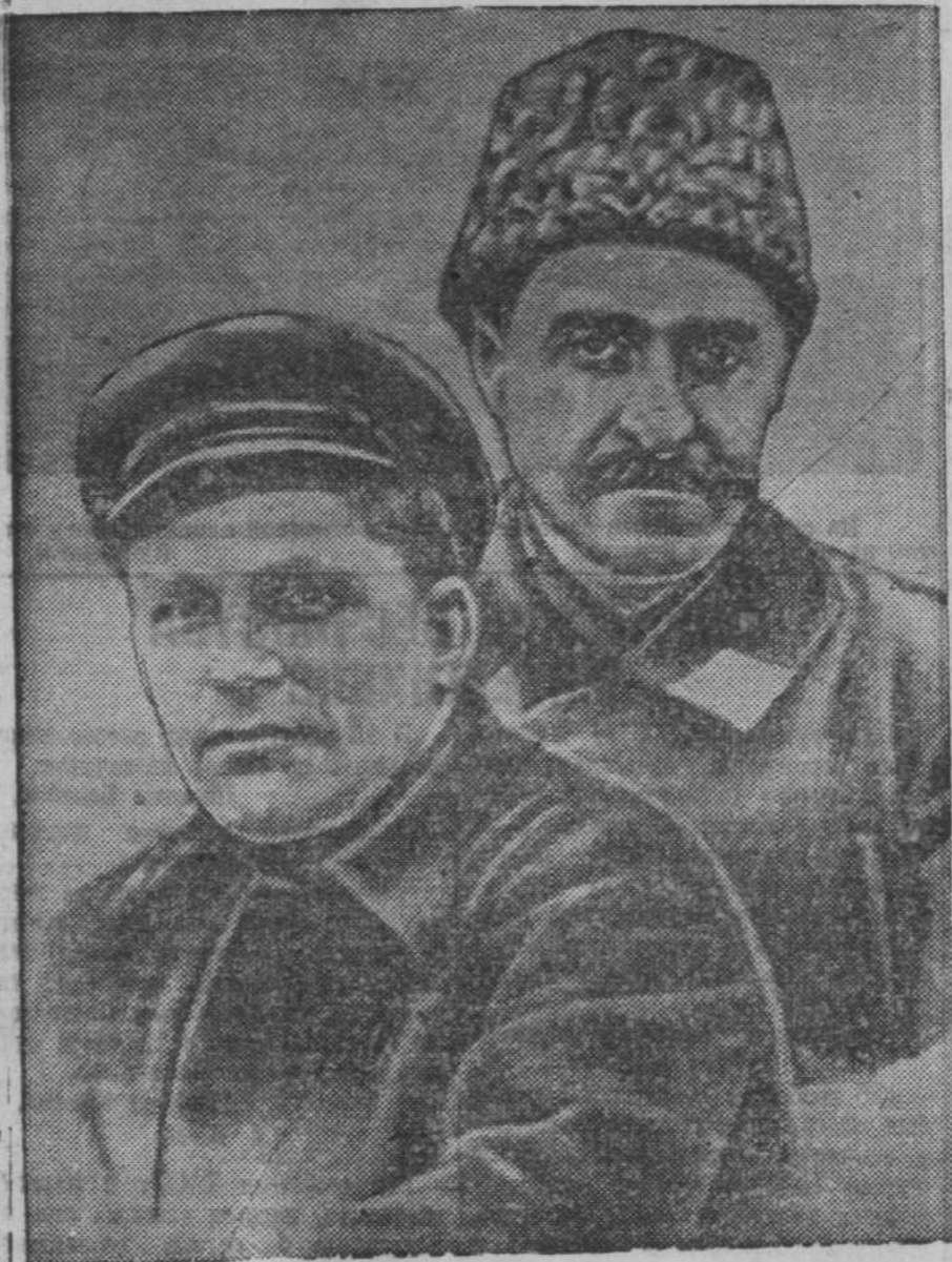
На снимке: гг. Орджоникидзе и Киров во время гражданской войны.

Я почти машинально вернулся в коридор. Лампочки потухли: провоза нестерпима. Темно. Глухо. Я прикричал каким-то истонченным голосом и сам своего голоса испугался. Но думал, что если кто-либо из товарищей и остался, то он меня примет за погромщика. Вернулся обратно,