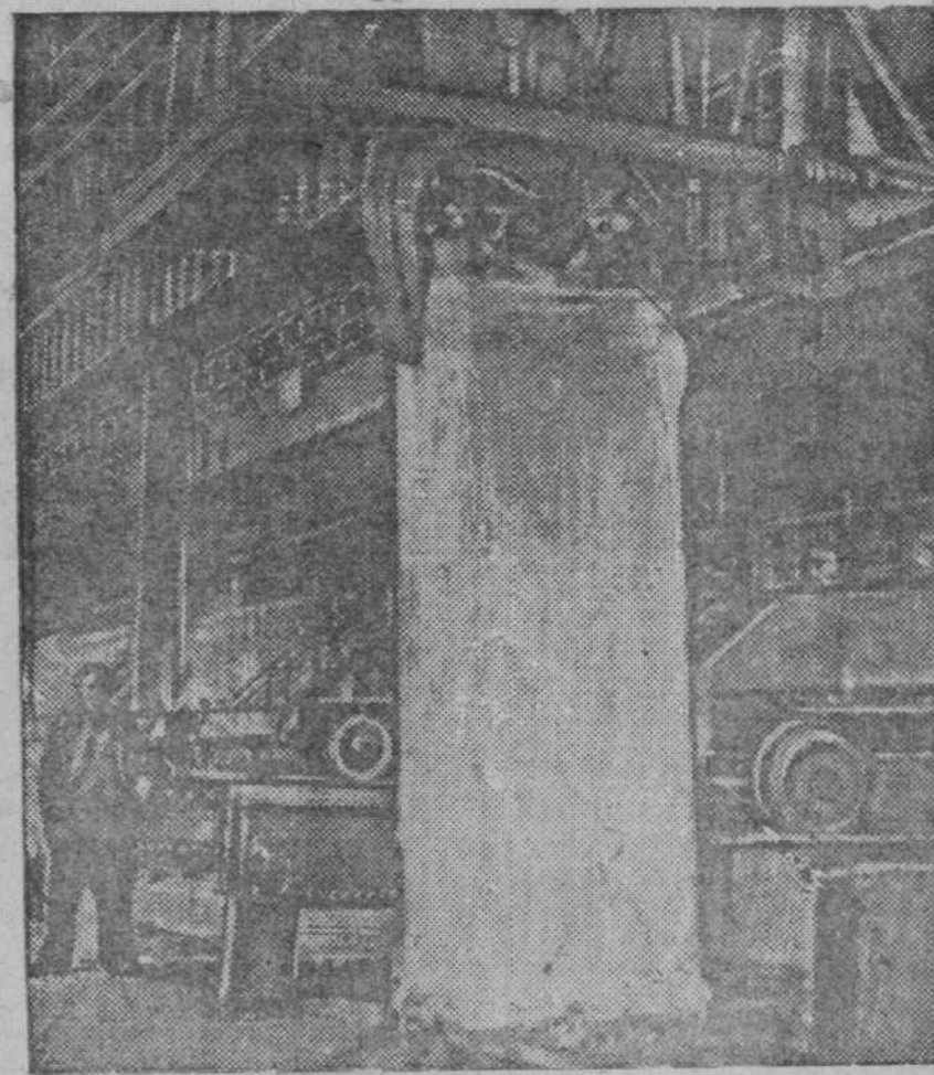
На нагревательных колодцах блюминга. На снимке: момент взятия слитка тиглеровским краном из колодца.