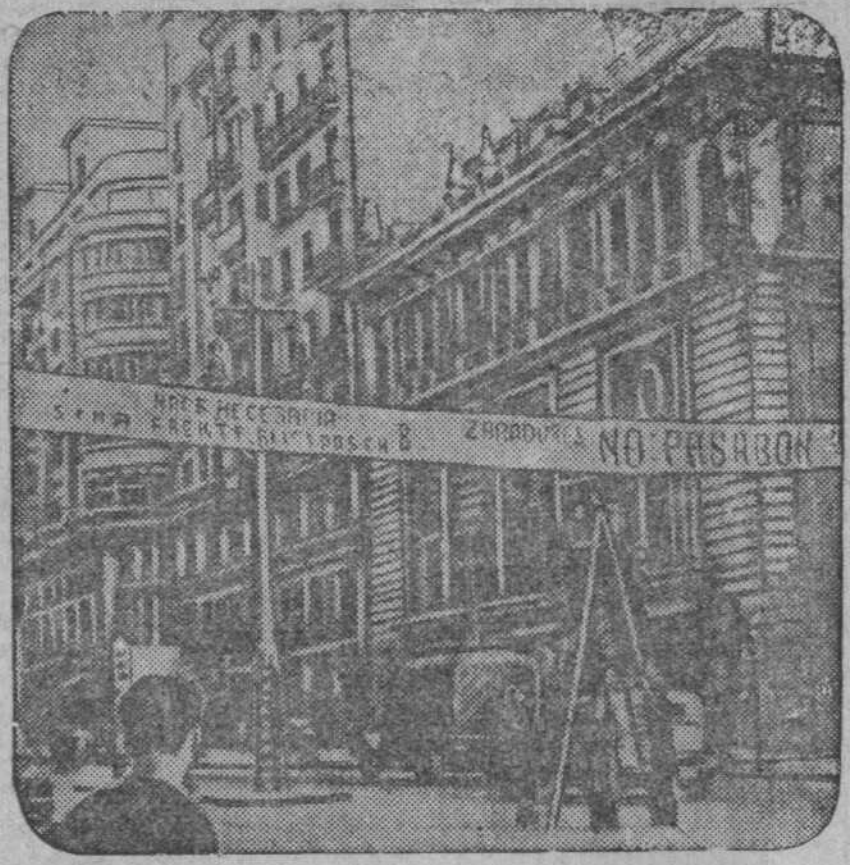
На снимке: плакат на мадридской улице с лозунгами и надписью «Они не пройдут»