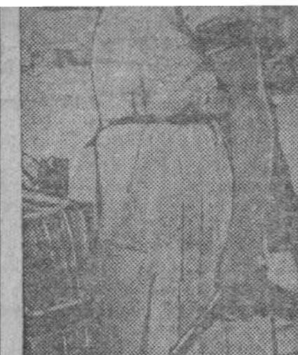
На снимке: вооруженная девушка — доброволец мадридской рабочей милиции.